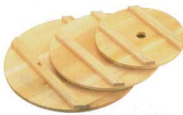
⑩ 落し蓋(押し蓋) さわら製