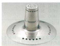
⑱ 吹きこぼれ防止器 湯ターン 18-8

φ200 (ジョイントをはずした時φ165) 厚み：2.5mm ●鍋のサイズに合わせジョイントを差して使えます。 ●中央に挿みやすいリング型ツマミと外周に菜箸等で取り出しやすい2つの穴があります。 ●循環したアクリルが溜まりやすい様に3本のリブが付いています。