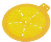
⑰ シリコン落し蓋 6730900

材質：シリコンゴム 耐熱温度230℃ 耐冷温度-10℃ ●耐熱・耐水・耐久性に優れたやわらかなシリコン素材なので食材の形にうまくなじみ、熱を効率的に循環させます。