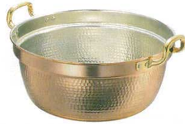
② 料理鍋 両手 銅製 SW