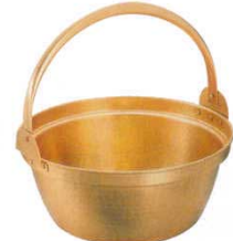
④ 山菜鍋 銅製(内側スス引き無し)