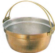
③ 料理鍋(吊付) 銅製 SW