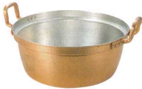
① 段付鍋 銅製 EBM