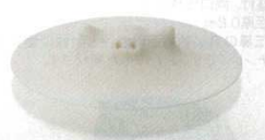
⑯ ぶたのおとしぶた