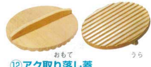
⑫ アクリル取り落し蓋