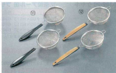
⑪ 茶漉 (PC柄) 18-8 ビクトリー 12

※シングルタイプ: 40メッシュ ダブルタイプ: 外側18メッシュ 内側60メッシュ