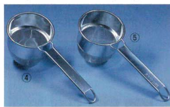
④ 茶漉 タタミ織 深型 18-8 10

φ85×215 (深さ45) 8374600 材質: 18-8ステンレス ※外網18メッシュ 内網60メッシュ