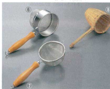
⑥ 茶漉 深型 木柄 18-8 12

φ82×210 (深さ82) 8644600 ※外側 18メッシュ 内側 40メッシュ