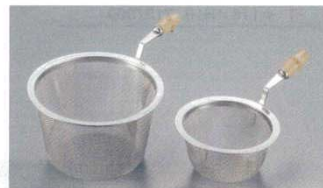
㉑ 竹柄付茶漉しアミ 急須用 18-8

適応口径サイズ 商品コード 50号 45~49用 5460600 55号 49~54用 5460700 60号 53~60用 5462500 65号 58~64用 5462600 70号 62~69用 5462700 73号 66~72用 5462800 75号 69~74用 5462900 78号 72~77用 8782800 80号 73~79用 5463000 82号 76~81用 5463100 85号 79~84用 5463200 88号 82~87用 8782900 91号 86~90用 5460800 98号 91~97用 5460900 110号 103~109用 5461000