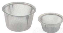
⑳ 茶こしアミ 急須用 18-8

適応口径サイズ 商品コード 50号 45~49用 5460600 55号 49~54用 5460700 60号 53~60用 5462500 65号 58~64用 5462600 70号 62~69用 5462700 73号 66~72用 5462800 75号 69~74用 5462900 78号 72~77用 8782800 80号 73~79用 5463000 82号 76~81用 5463100 85号 79~84用 5463200 88号 82~87用 8782900 91号 86~90用 5460800 98号 91~97用 5460900 110号 103~109用 5461000