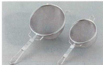
① ストレーナー (茶漉兼用) ダブルアミ EBM 12

深さ 商品コード 大 φ130×285 80 0221300 小 φ100×215 70 0221400 ※使用金網: φ0.29×24メッシュ (外側) φ0.16×40メッシュ (内側)