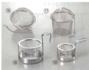
⑯ ボール茶漉 18-8 ビクトリー

深さ 商品コード 大 φ75×170 55 6277600 小 φ65×160 45 6277700 ※ダブルアミ: 外側16メッシュ 内側40メッシュ