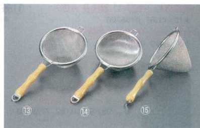
⑬ 茶こし 丸型 タ華 18-8 12

※シングルタイプ: 40メッシュ ダブルタイプ: 外側18メッシュ 内側40メッシュ