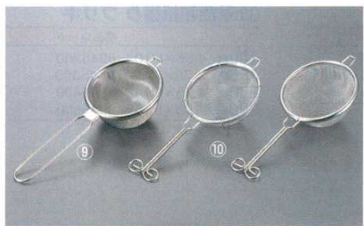
⑨ 茶漉 ハイテック 18-8 ビクトリー 12 (タタミ織200メッシュ)

深さ 商品コード 大 φ90×190 100 0742600 中 φ70×170 90 0742700