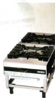
③ガステーブルコンロ OZ50-60LD 台付スープ用