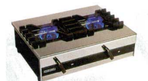
①ガステーブルコンロ OZ60K