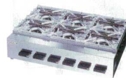
⑦ガステーブルコンロ OZK6Ⅲ