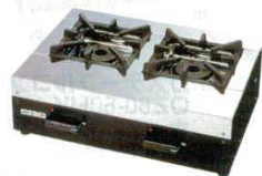
②ガステーブルコンロ OZ55K