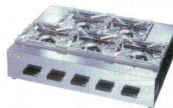
⑥ガステーブルコンロ OZK5Ⅲ