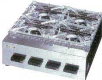
⑤ガステーブルコンロ OZK4Ⅲ