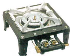
① ガステーブルコンロ MD-701 1連