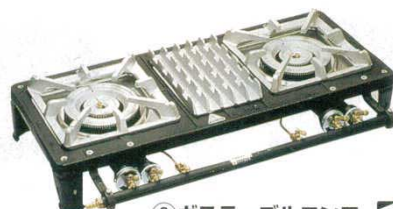
③ ガステーブルコンロ MD-702L 2連大