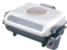
⑪ フィッシュロースター KFA-A130 タイガー 6813810

外寸：438×332×H196 重量：5.5kg 電源：単相100V 消費電力：1,300W ●焼きムラの少ないクロスワイドヒーター。 ●1,300Wのハイパワー両面焼き。 ●30分タイマー付。 ●煙やニオイを分解する触媒フィルター付。