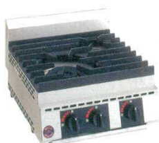
⑦ テーブルコンロ 厨太くん TB-X2