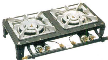
② ガステーブルコンロ MD-702 2連