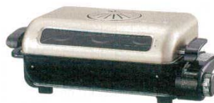
⑫ フィッシュロースター EF-VT40 象印 3158310

外寸：438×332×H196 重量：5.5kg 電源：単相100V 消費電力：1,300W ●焼きムラの少ないクロスワイドヒーター。 ●1,300Wのハイパワー両面焼き。 ●30分タイマー付。 ●煙やニオイを分解する触媒フィルター付。