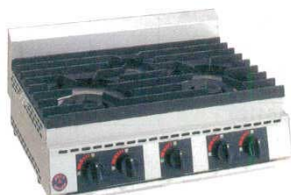
⑧ テーブルコンロ 厨太くん TB-X3