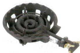
⑰ガスコンロ 2重 (羽根付き) DE-22n (13A)