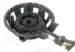
⑯ガスコンロ 2重 (羽根ナシ) DE-21n (LP)