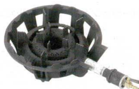
⑮ガスコンロ1重中型 (4号) DEJ-15SL (LP) DEJ-15SC (13A)