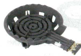
⑲ガスコンロ 4重 DE-44n