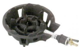
⑭ガスコンロ1重並 (常用) DEJ-11SL (LP) DEJ-11SC (13A)