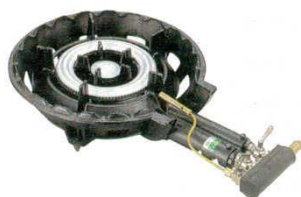
③ガスコンロ SG-2 SG型 サントク ※パイロット付