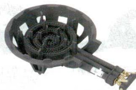
⑱ガスコンロ 3重 DE-33n