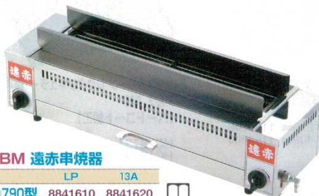
EBM 遠赤串焼器 LP 13A ③ 790型 8841610 8841620 ④ 940型 8841710 8841720 ※左・右独立点火式