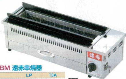
EBM 遠赤串焼器 LP 13A ① 500型 8841410 8841420 ② 640型 8841510 8841520