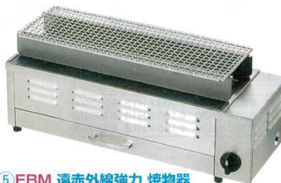
⑤ EBM 遠赤外線強力焼物器 [NEW炭火] 13A 530型 2720020