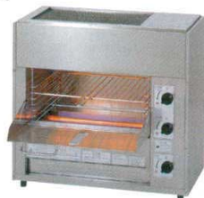
⑫ 焼物器 RGW-2 小型両面 リンナイ

両面焼ですので、食材のかたくずれがなくきれいに、かつ早く焼き上がります。焼網の高さは食材に合わせて変更できます。下火は熱板式パイバーナーにより、煙の発生が少ない構造です。立消安全装置付の安全設計です。設置スペースを考えた奥行260のコンパクトタイプ。