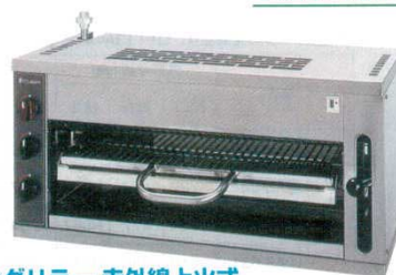
⑭ グリラー 赤外線上火式 FGS90