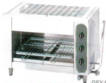
グリラー赤外線上火式 GSY-90T