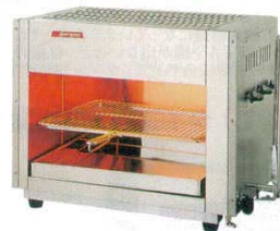
グリラー 赤外線上火式 グリルクイン アサヒ