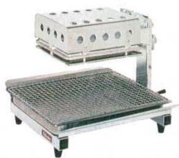
⑬ 焼物器 PY-8 パロマ

煙の少ない赤外線タイプ。赤外線の火力でおいしさは保証付。汁受皿は汚れに強いステンレス製。