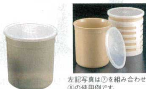
左記写真は⑦を組み合わせた⑧の使用例です。