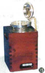
⑮ 卓上酒燗器 ミニかんすけ

寸法: 260×260×H260 1093400 水槽内寸法: 215×215×H115 (1合徳利8~9本) 温度: 30°C~90°C可変サーモ 電源: 単相100V 消費電力: 1kW ※酒タンポは別売ります。