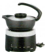
⑨ 酒燗器 TW-4418B

3911600 外寸: 175×140×H220 消費電力: 240W 酒器容量: 約300ml (一合半) 温度調節範囲: 約37~60°C (4段階: 人肌燗/上燗/熱燗/飛切燗) 材質: AL / フッ素加工(酒器) PP / (取っ手、蓋、本体)