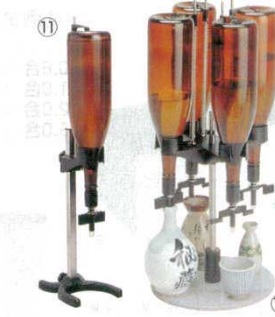
⑪ ワンショットメジャー (スタンド式) マルチ 本体寸法: φ300×H700 ⑪ 一連型 145×190×H400~750 5615000 ⑫ 四連型 φ300×H400~760 4923900