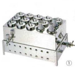
① 燗ドーコ 18-8 EBM (マッチ点火)