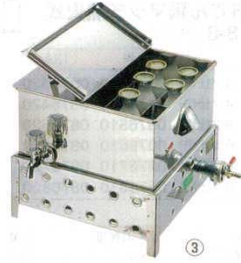
③ 燗ドーコ バラ付 18-8 EBM (マッチ点火)