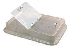
⑥ 燗ドーコ部品 HS-120 専用フードカバー タイジ

外形: 427×295×H210 内寸: 372×262×H114 定格電圧: 単相100V 50/60Hz 消費電力: 720W 収容数: 一合銚子約24本/二合銚子約15本 専用パット容量: 12ℓ 温度調節: 可変式サーモスタット 標準温度20°C~100°C 安全装置: 温度ヒューズ 重量: 6kg 付属品: スノコ1、ビンキャップ1、おかんメーター1