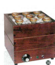
⑭ 電気式燗どうこ かんすけ TK-4型

寸法: 260×260×H260 1093400 水槽内寸法: 215×215×H115 (1合徳利8~9本) 温度: 30°C~90°C可変サーモ 電源: 単相100V 消費電力: 1kW ※酒タンポは別売ります。