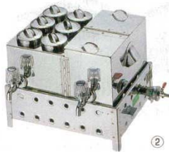
② 燗ドーコ タオルムシ器付 18-8 EBM (マッチ点火)