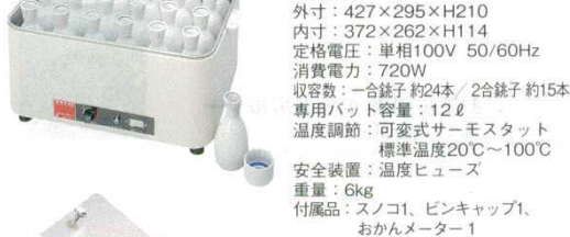
⑤ 燗ドーコ HS-120 (どうこ仕様) 電気式 タイジ 0895800

外形: 427×295×H210 内寸: 372×262×H114 定格電圧: 単相100V 50/60Hz 消費電力: 720W 収容数: 一合銚子約24本/二合銚子約15本 専用パット容量: 12ℓ 温度調節: 可変式サーモスタット 標準温度20°C~100°C 安全装置: 温度ヒューズ 重量: 6kg 付属品: スノコ1、ビンキャップ1、おかんメーター1