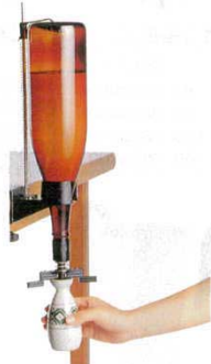
⑩ ワンショットメジャー 一連型 (固定式) マルチ 4923800 本体寸法: 145×H390 最大固定ピッチ: 42mm

3911600 外寸: 175×140×H220 消費電力: 240W 酒器容量: 約300ml (一合半) 温度調節範囲: 約37~60°C (4段階: 人肌燗/上燗/熱燗/飛切燗) 材質: AL / フッ素加工(酒器) PP / (取っ手、蓋、本体)