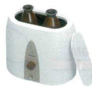
⑦ 電気式燗どうこ タイジ HS-2 3133600 1合銚子 3本 / 2合銚子 2本