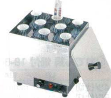
⑧ 電気式燗どうこ タイジ HS-8N 3134300 1合銚子 8本 / 2合銚子 6本