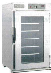
⑤ 温蔵庫NB-60EG 遠赤外線式ビーフェポット ニッセイ 3133100