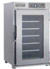
④ 温蔵庫NB-100EG II 遠赤外線式ビーフェポット ニッセイ 6001800