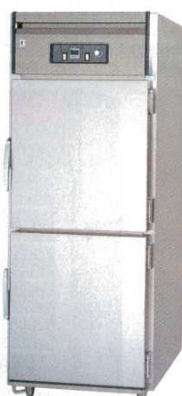
⑧ 温蔵庫FWC75854WH 電気式 (加湿機構付) バスルータイプ