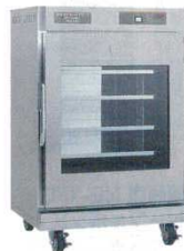
③ 温蔵庫遠赤外線式 NB-200EG 8346800