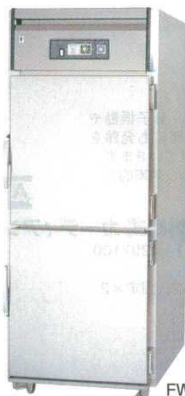
温蔵庫電気式 (加湿機構付) 750×800×H1,950

温蔵温度・湿度をコントロール 温蔵する食品に合わせて温度・湿度を調節することができる温蔵庫です。 ご飯の長時間温蔵も実現 ご飯を長時間温蔵した場合の褐変現象 (メイラード反応) を防止し、約18時間の温蔵を可能にしました。 強制循環でムラなく温蔵 熱と蒸気はファンにより強制的に循環され食品を包み込みながら温蔵を行います。