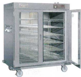
① 温蔵庫NB-600EGW 遠赤外線式ビーフェポット ニッセイ (ポリカーボネート扉) 3133200 ●別売リシートパン (660×455) サイズが12枚 収納出来ます。

料理を芯から温め、しかも乾燥やべたつきを抑え、作りたての美味しさを長時間保ちます。 遠赤外線温蔵庫は、お料理の乾燥を極力抑え、芯からやさしく保温します。 庫内の両サイドと下面に取り付けた遠赤外線パネルヒーターによって、温度ムラを少なくしました。