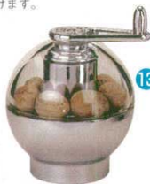
⑩ ナツメグミル テルナート 19006 プジョー 3162300 φ90×H90 ●挽き立てのナツメグの香りを楽しめます。