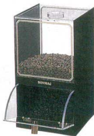
⑪ コーヒーケース W-II ボンマック 4014800 180×200×H324 容量：約2kg 材質：アクリル樹脂 ●上に重ねられます。