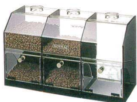
⑩ コーヒーケース S-3 ボンマック 4014700 422×170×H250 容量：約1kg×3 材質：アクリル樹脂