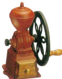
③ ダイヤミル 3144100 高さ：H240 ※鋳鉄製、硬質鋳鉄製臼歯使用