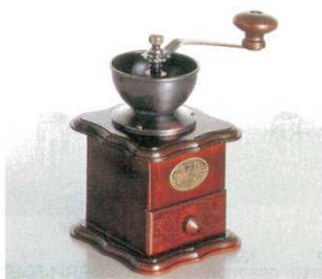
② コーヒーミル MHE-4 ホビー 5249700 外寸：165×120×H200 本体：鋳鉄製 台：木製