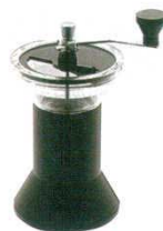
⑦ コーヒーミル ファンタジスタ 7574900 外寸：155×112×H215 容量：300ml 材質：本体／ABS樹脂 刃／セラミック