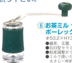
⑥ お茶ミル セラミック ポーレックス（緑） 8192400 φ53.2×H136 ●碾茶、玉露、煎茶、番茶等々、種々の茶葉が手軽に抹茶状に挽けます。 ●石臼型セラミック刃は取りはずしができ、水洗いも可能です。 ●粒度調整ができます。 ●ミルで挽いたお茶の目安量 大さじ一杯約6g 小さじ一杯約1g