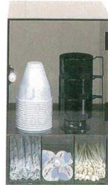
⑫ アクセサリーボックス ボンマック 4014900 220×260×H350 材質：アクリル樹脂 ※ボックス内のカップなどは別売ります。