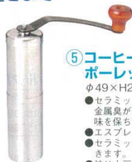
⑤ コーヒーミル セラミック ポーレックス 8192300 φ49×H226 ●セラミック刃なのでコーヒーの風味をそこないません。金属臭が無く、錆等の心配もありません。磨耗しにくく、良い切れ味を保ちます。 ●エスプレッソ用から、粗挽きまで、粒度調整が簡単にできます。 ●セラミックの内刃、外刃とも取りはずしが出来、清掃、水洗いができます。 ●焙り大豆を挽いて、自家製のきな粉づくりに、ご利用いただけます。