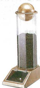
⑨ コーヒーケース グローバル 8G ボンマック 4014600 182×290×H548 容量：約2kg 材質：アクリル樹脂