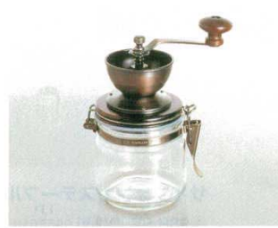
④ キャニスターミル CMH-4C 4347900 外寸：175×105×H200 容量：400cc ●刃は鋳物でなく可鍛鋳鉄という堅い鉄を使用。コーヒー豆の挽き味も抜群です。