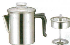
⑭ パーコレーター 18-8 仔犬