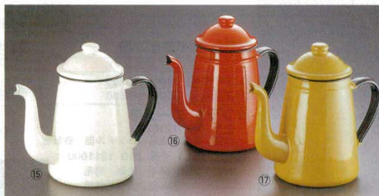
ホーロー コーヒーポット キリン印

※コーヒー粉をバスケットに入れ、火にかけるとパイプを通してお湯が間欠的に噴き上がりその繰り返しにより、濃厚なコーヒーが楽しめます。