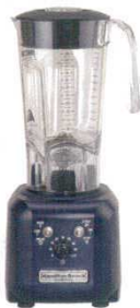
⑪ パーブレンダー HBH450 ハミルトンピーチ

170×210×H530 3137810 ボトル容量：1.9ℓ (ステンレス) 定格電圧：単相100V 50/60Hz (3分定格) 消費電力：740W 重量：4.3kg 回転数：ハイ 23,000/分 ロー 18,000/分