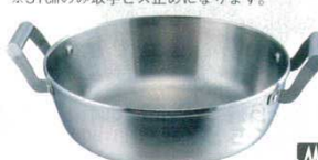
⑦天ぷら鍋 ロイヤル