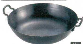
⑤揚鍋 打出 鉄製