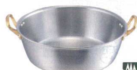
⑥揚鍋 キングデンジ