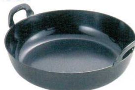
③揚鍋 プレス製 厚板 鉄製 EBM (ハンドル一体品)