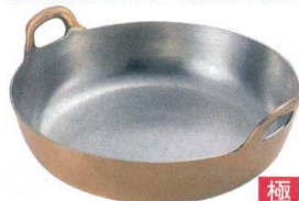
①揚鍋 プレス製 銅製 EBM (ハンドル一体品)

EBM揚鍋は材料を一枚板から絞っているため、ひび割れ・小さなツブ状の穴は見られません