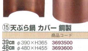
⑮天ぷら鍋 カバー 銅製

200V電磁調理器は非常にパワーがあるため、鍋の変形防止・安全面からボリュームは中以下で、鍋の状態、内部の温度には細心の注意をお願いします。