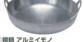
⑪揚鍋 アルミイモノ