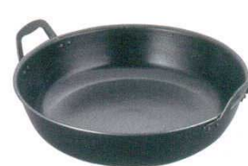
④揚鍋 鉄製 ナカオ