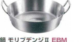
⑰揚鍋 モリブデンⅡ EBM