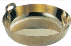
②揚鍋 プレス製 真鍮製 EBM (ハンドル一体品)