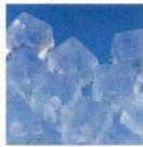
キューブアイス 28×28×32 (セル方式)