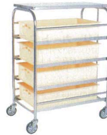
コンテナラックワゴン SK-24E

材質：ステンレスフレーム ※コンテナは別売です。 適用コンテナ：PP番重G-10・G-20 P131-3参照