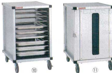
PTフレックスカート

782×551×H983 材質：アルミニウム(総アルマイト仕上げ) ※φ125ウレタンキャスターを標準装備 (対角ストッパー付き) ※特寸などのオーダー製作も可能です。