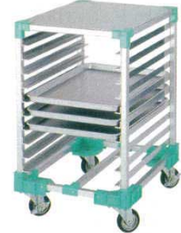
⑦ ビッグトレイラック AP-BT10 10段 4355700

材質：ステンレスフレーム ※コンテナは別売です。 適用コンテナ：PP食品用コンテナ#0 P133-1参照