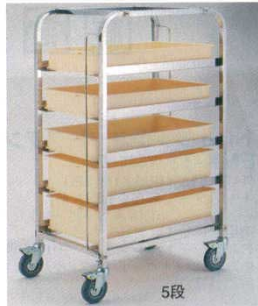
コンテナカート ステンレス EBM

商品コード ① 8段 720×490×H1,760 8810000 ② 5段 720×490×H1,280 8810100