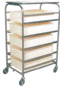
コンテナラックワゴン SK-25E

商品コード ③ ストッパー無 6378000 ④ 片面ストッパー付 6376200