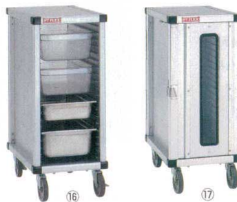
PTフレックスカート

782×551×H1,733 材質：アルミニウム(総アルマイト仕上げ) ※φ125ウレタンキャスターを標準装備 (対角ストッパー付き) ※特寸などのオーダー製作も可能です。