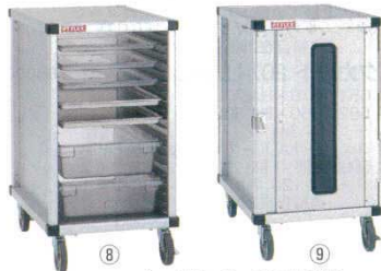
PTフレックスカート

適用トレイ： シートパン大・小 P103参照 アルミシルバーストーン天板 P103参照