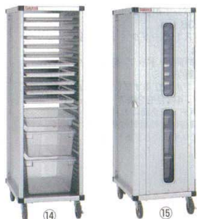
PTフレックスカート

646×421×H1,733 材質：アルミニウム(総アルマイト仕上げ) ※φ125ウレタンキャスターを標準装備 (対角ストッパー付き) ※特寸などのオーダー製作も可能です。