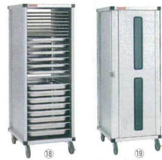
PTフレックスカート

646×421×H983 材質：アルミニウム(総アルマイト仕上げ) ※φ125ウレタンキャスターを標準装備 (対角ストッパー付き) ※特寸などのオーダー製作も可能です。