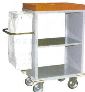
④ メイドサービスワゴン SH-10E

フルサイズ：1,590×660×H1,000 材質：スチールメラミン焼付 コップ入れ袋：綿帆布（容器約24ℓ） キャスター：φ150（自在×2 固定×2） ●ホテルでのルームメイクを効率よく、スピーディに進めるための「補充用ワゴン」。一度に40室（40ベッド）分もの補充品が積みこめるだけでなく、作業別分類が作業動線のプロセスにより設計されており、迅速にメンテナンスが処理できます。