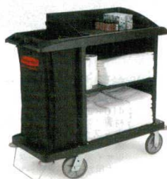
ハウスキーピングカート

外寸：1,470×590×H1,315 0446700 キャスター：φ100×6 自在 材質：荷台/ポリプロピレン フレーム/スチールパイプ 回収袋/ナイロン（100ℓ×2） 重量：34kg