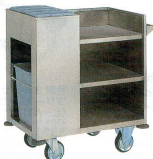
② バッシングワゴン EMN-B4 7722900

外寸：715×440×H900 キャスター：φ100、ゴム車（4輪自在） 材質：ステンレス ※バスボックス、ポリベールは別売です。 ※別売：P976-⑩・⑪ キャンプロバスボックス21155CBR が1ヶ、21157CBRが2ヶ、P820-⑩ ファブフレーム15型1ヶをセットすることができます。