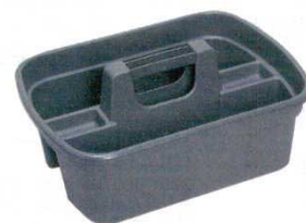
⑩ ハンドキャディー SCA246

フルサイズ：660×1,280×H725 材質：フレーム/スチールパイプメラミン焼付塗装 リネン袋/綿帆布（容器約172ℓ） ぬれ物用袋/綿帆布（容器約54ℓ） キャスター：ゴム製φ125・自在ストッパー付 ×2・固定×2 大袋サイズ：550×570×H610 小袋サイズ：550×260×H400 重量：27kg 積載荷重：60kg ※壁面にキズをつけない回転式バンパー採用 補充作業と同時に終わる回収作業も、能率よくスピーディであることが要求されます。ホテル用ワゴン「回収用タイプ」は、面倒な仕分け作業がラクにこなせるよう2種類のリネン袋を採用しました。