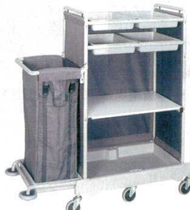
⑤ 静音メイドサービスワゴン シングル SKT-1

外寸：1,000×500×H1,168 6378300 キャスター：φ150（自在×2、固定×2） 袋：サイズ/400×200×H600 容量/約150ℓ 材質：スチールボード焼付塗装仕上 ●小型のメイドワゴンの中ではもっともポピュラーな機種です。