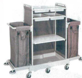
⑥ 静音メイドサービスワゴン ダブル SKT-2

外寸：1,200×590×H1,315 0445900 キャスター：φ100×6 自在 材質：荷台/ポリプロピレン フレーム/スチールパイプ 回収袋/ナイロン（100ℓ） 重量：30kg