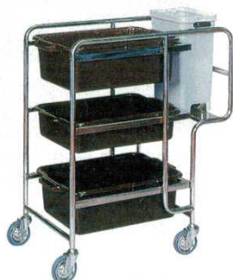
① バッシングワゴン SG-31S 5189700

外寸：715×440×H900 キャスター：φ100、ゴム車（4輪自在） 材質：ステンレス ※バスボックス、ポリベールは別売です。 ※別売：P976-⑩・⑪ キャンプロバスボックス21155CBR が1ヶ、21157CBRが2ヶ、P820-⑩ ファブフレーム15型1ヶをセットすることができます。