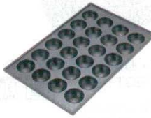
⑦ たこ焼用鉄板 ジャンボ 24穴用 IT 8380600 360×229×H35