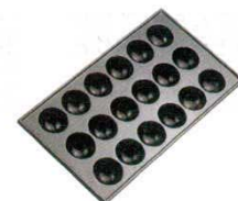
⑥ たこ焼用鉄板 ジャンボ 18穴用 IT 6962100 344×190×H30