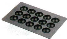
⑨ たこ焼用鉄板 15穴 250×160×H27 3159200