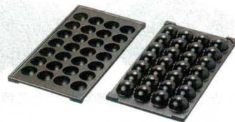
③ たこ焼台鉄板 28穴用 (足付) 344×190×H30 6045800