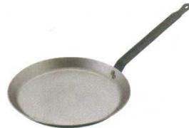
④ クレーパン 鉄製 マトファー