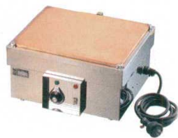
⑫ 電気式ホットプレート