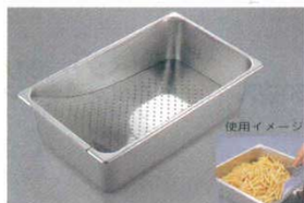
⑬ イージーミキシングプレートセット 18-8 530×327×H100・H150