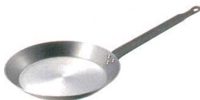
⑤ クレーパン 鉄製 SW