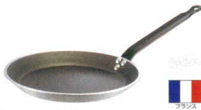
② クレーパン アルミノンスティック デバイヤー