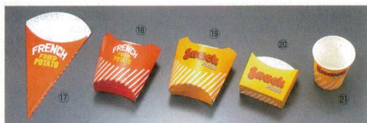
⑭ 三角ポテト袋 赤 3000枚入

※テーブルパン150mmとセットでご使用下さい。 ※目皿が湾曲、斜めにセットされるため、内容物をかきまぜたり、すくう作業が、とてもスムーズ、スピーディーに行えます。