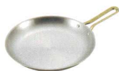
⑥ クレーパン ブレイクッキング 銅製