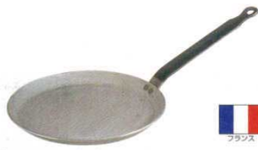
③ クレーパン 共柄 鉄製 デバイヤー