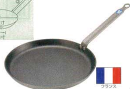
① クレーパン アルミノンスティック ブラウジャ