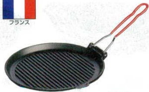
① グリルパン 丸型 120 23 23 8879100 φ270×H20 重量：1.9kg ●ハンドル取り外し可能