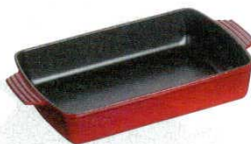
⑧ ロースト天板 3039 03 (赤) 1896300 380×250×H100 容量：3.5ℓ 重量：4kg