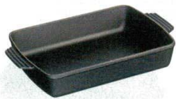
⑦ ロースト天板 3039 23 (黒) 1896200 380×250×H100 容量：3.5ℓ 重量：4kg