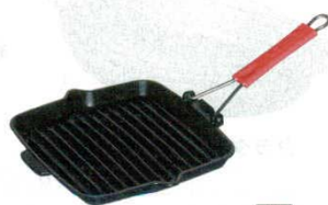
②⑩ グリルパン 正角型 120 21 23 8879210 240×240×H25 重量：1.8kg ●ハンドル取り外し可能