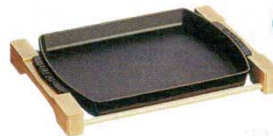
⑩ プレート 角 木枠付 12052 23 6663900 本体サイズ：内寸300×200×H30 木枠サイズ：外寸380×230×H40 重量：2.0kg ●木枠に乗せて卓上へサーブ