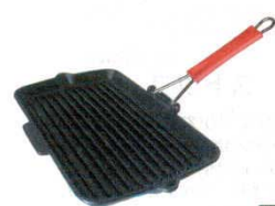
⑪⑮ グリルパン 長角型 120 22 23 8879310 340×210×H25 重量：2.7kg ●ハンドル取り外し可能