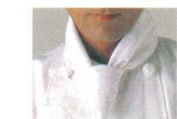
⑯ 四角巾 JY4925-0