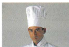
⑫ コック帽 JW4610-0 山高帽 ⑩