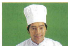
⑬ コック帽 JW4605-0 洋帽子 ⑩