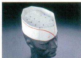
⑥ A96002 (100枚入) RED LINE 7495900