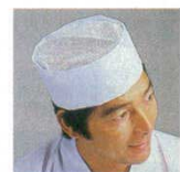
⑮ 和帽子 JW4621-0 メッシュ ⑩