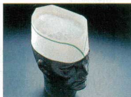
③ A95004 (100枚入) GREEN LINE 6048200