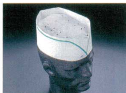
⑦ A96004 (100枚入) GREEN LINE 7496000