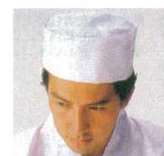
⑭ 和帽子 JW4622-0 細布和帽子 ⑩