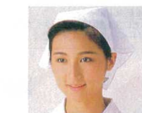
⑰ 三角巾 JY4920-0 ⑩