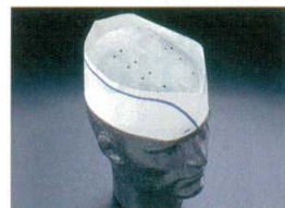
⑧ A96008 (100枚入) BLUE LINE 7496100