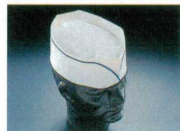
④ A95008 (100枚入) BLUE LINE 6048300