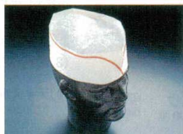
② A95002 (100枚入) RED LINE 6048100