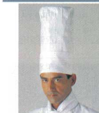
⑪ コック帽 JW4602-0 チーフ帽・ピンタック ⑤