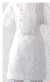
⑥ 調理用前掛 TT8700-0