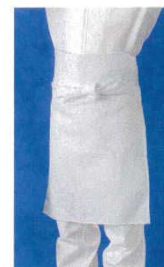
⑧ 前掛 SB36 サシコ (ホワイト) 8470900