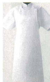
⑦ 前掛 JT4511-0(揚前掛) 3706500