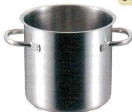
①寸胴鍋 (蓋無) 1001 パデルノ