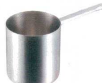
⑫パンマリーポット 1910 パデルノ