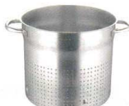
⑪スチームポット 1123 パデルノ