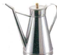
⑬オイルポット 1780 パデルノ