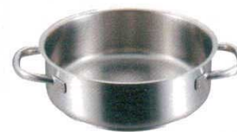
③外輪鍋 (蓋無) 1009 パデルノ

非電磁対応 1007 パデルノ 50cm (58.0ℓ) H300 6266910