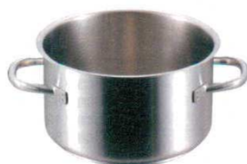
②半寸胴鍋 (蓋無) 1007 パデルノ

非電磁対応 1001 パデルノ 50cm (98.0ℓ) H500 6266210