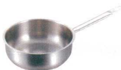
⑦ソテーパン (蓋無) 1113 パデルノ