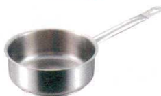
⑤浅型片手鍋 (蓋無) 1008 パデルノ