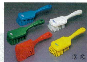
⑨ハンドル付ブラシ ソフトタイプ 4187