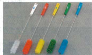
⑭パイプクリーナー ハードタイプ 5378