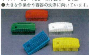
⑦まな板洗浄ブラシ ソフトタイプ 6441