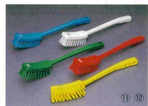
⑪長柄ハンドル付ブラシ ソフトタイプ 4183