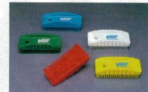
⑥ネイルブラシ ハードタイプ 6440