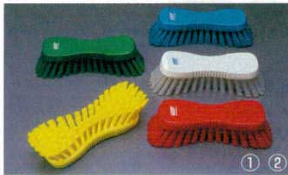
①ハンドブラシ ソフトタイプ 3887