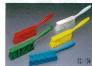
⑬ペーカリーブラシ ソフトタイプ 4586