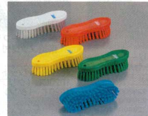
③ハンドブラシ ソフトタイプ 3587