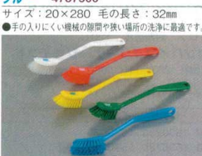
⑮ディッシュブラシ ソフトタイプ 4287