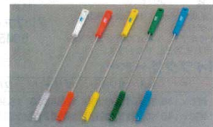
⑬パイプクリーナー ハードタイプ 5376

●粉末の清掃に適したブラシ。製パン、製麺など粉末を使用するカウンターの清掃に最適です。