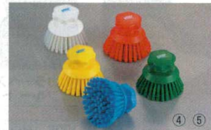
④ハンドブラシ 丸ソフトタイプ 3883