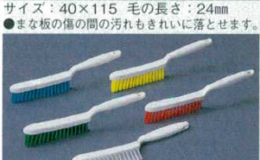
⑧スモールハンドルブラシ 4195