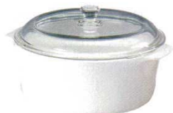
⑪両手鍋 13955 (2ℓ)