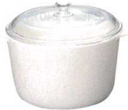
⑫両手鍋 13956 深型(3ℓ)