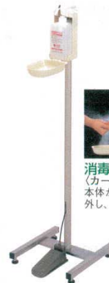
⑧手指消毒器 HC-400 足踏式 8465000 寸法：315×372×H1,100 質量：約3.5kg 噴射量：約1.2cc/回 操作方法：足踏ペダル式 使用方法：指先に噴射できるよう指を立てノズルの下に手を入れて下さい。ペダルを踏むと指先に消毒液が噴射します。手指全体になり込み、特に指先はていねいに殺菌・消毒して下さい。