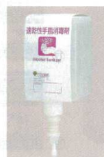
⑦UD-3100専用アルコール手指消毒器 4007300 容量：1ℓ ●広範囲の微生物に有効で迅速な殺菌効果を発揮します。 ●速乾性ですので両手のすり込みで蒸発することから手を拭く必要がなく交差汚染の恐れがありません。