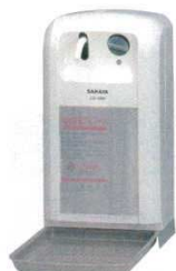
⑤自動手指消毒器 UD-1000 (アルコール用) 8465100 寸法：144×106×H255 質量：約740g 噴射量：約1.4cc/回 電源：アルカリ乾電池/4本 (DC 6V) 使用方法：ノズルの下に両手を揃えて差し出すと、消毒液が噴射(吐出)します。1回あるいは2回作動すると停止します。