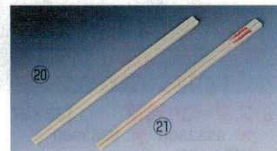
⑳ 中華箸 無地