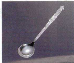
⑤ 中華レンゲ ドラゴン 18-8 全長201 7343700