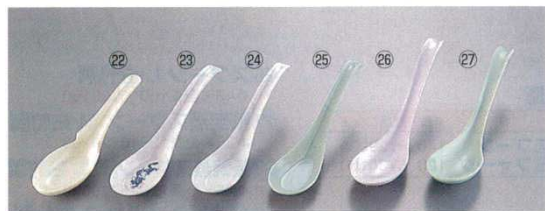
㉒ レンゲ引機式 クリーム メラミン 50