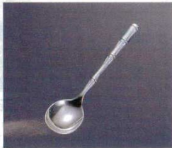
⑦ 中華レンゲ 竹模様 18-8 全長175 7343900