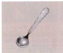
⑧ 中華レンゲ 吉祥 18-8 全長180 7343500