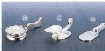
㉘ 箸・スプーンスタンドロータス UK