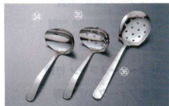
㉞ 調味レードル 横口 ライラック 18-8