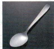
㊲ チャーハン・オムライススプーン ライラック 18-0