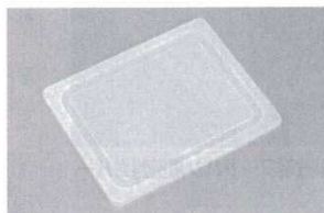
⑥ホットパンカバー 密封型 洗 洗 ※電子レンジにはご使用できません。 (フードパンにもご使用いただけます)