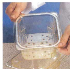
⑧コランダーホットパン 洗 洗