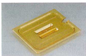
④ホットパンカバー 切込/取手付 洗 洗 ●スプーンやレードルを差し入れたまま蓋を閉める事が出来ます。