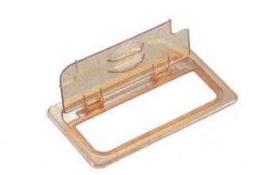
⑦ホットパンカバー 切込ヒンジ付 洗 洗 ●蓋が上に開くので、取り外さなくても中身を簡単に取り出す事が出来ます。