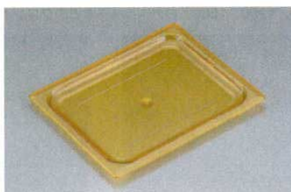
②ホットパンカバー 平面蓋 洗 洗