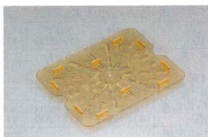
⑤ドレンシェルフ ホットパン用(水切目皿) 洗 洗 ●野菜、果実を洗った後や、肉、魚及び冷凍食品の解凍後の水切りに最適です。