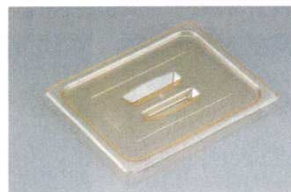
③ホットパンカバー 取手付 洗 洗 ●深い取手でつかみやすい