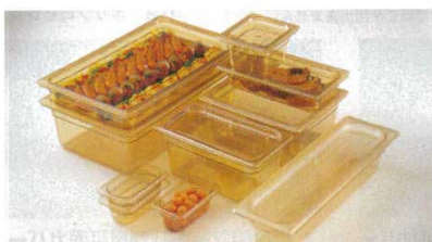
①ホットパン 洗 洗

キャンブロフードパンはガストロノーム（国際基準）規格（GNサイズ）を採用しています。