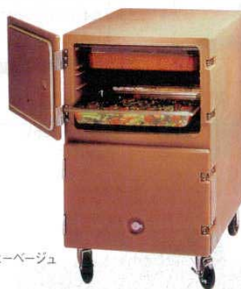
③ コーヒーベージュ