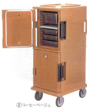
② コーヒーベージュ