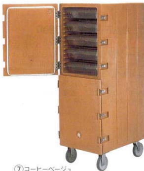
⑦ コーヒーベージュ