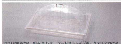
DD1826SCW 組み合わせ フードストレイジボックス18263CW