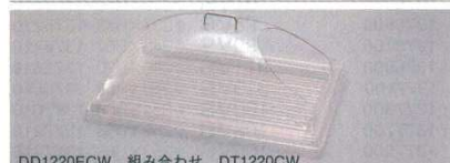
DD1220ECW 組み合わせ DT1220CW