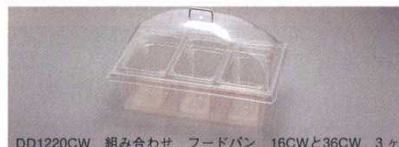
DD1220CW 組み合わせ フードパン 16CWと36CW 3ヶ