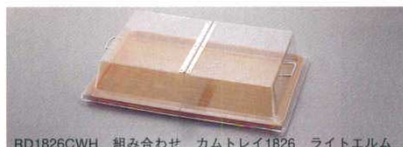
RD1826CWH 組み合わせ カムトレイ1826 ライトエルム