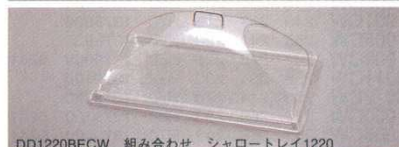
DD1220BECW 組み合わせ シャロートレイ1220