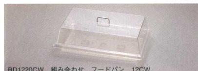
RD1220CW 組み合わせ フードパン 12CW

キッチンのタイルに落としても割れません。コンテンポラリーなクロームハンドルが高級感を与えます。