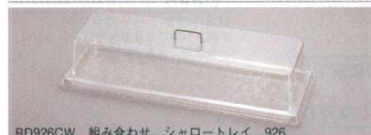
RD926CW 組み合わせ シャロートレイ 926