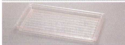
⑧ディスプレイトレイ DT1220CW 530×325×H40 4118800