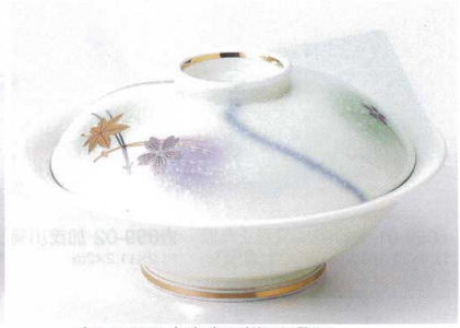
カ100-07 白吹竜田川7.0骨むし φ21×11.6cm 5,300円