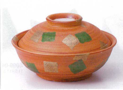
ネ100-04 金緑彩大蓋向(6.0) φ18×10.5cm 7,000円 ネ100-05 金緑彩蓋向 φ13.3×8.3cm 4,400円 ネ100-06 金緑彩円菓子碗 11×8.5cm 4,000円