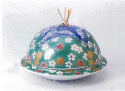
ト100-09 濃グリーン交趾春秋丸型蓋向 φ15.8×9.8cm 3,650円