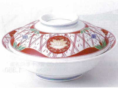
ツ100-01 錦華陽紋8.0骨むし φ24.3×12.5cm 8,200円 ツ100-02 錦華陽紋7.0骨むし φ21.5×10cm 5,100円 ツ100-03 錦華陽紋蓋向 16.5×9.5cm 2,850円