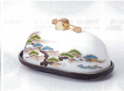
ミ100-12 小棺蓋物 16.5×9.4×8.3cm 3,350円