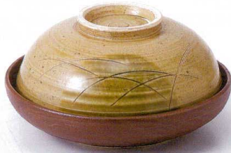
ミ100-08 灰織部煮物 φ15.4×8.5cm 8,800円