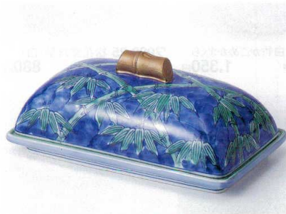
ミ100-11 青交趾竹長角蓋向 20.3×11.3×8.5cm 7,300円