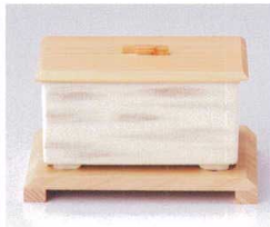
ト111-35 黄結晶角蒸鉢 11.5×8×6cm 2,350円