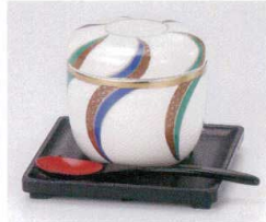
ミ111-23 夏目金彩ネジリむし碗 φ7.8×7.5cm 2,150円