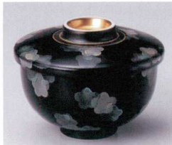
ホ111-27 金巻花ちらし大むし碗 φ11×9cm 2,100円