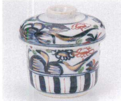
ネ111-11 古染万暦むし碗 φ7.7×8.5cm 2,200円