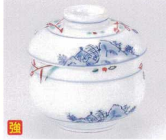
カ111-04 赤絵京山水むし碗 φ8.5×9.7cm 2,600円