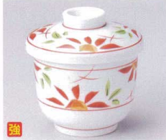
ウ111-12 ミツ花京型蒸碗 φ7.6×8.8cm 2,300円