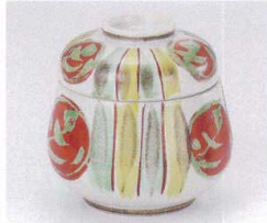
ツ111-08 十草赤丸紋だるま型むし碗 φ8.2×8.5cm 2,350円