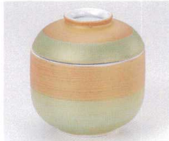
ト111-21 曙金彩むし碗 φ7.5×8.2cm 2,150円