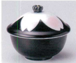
ミ111-17 黒釉桜花むし碗 9.6×8.3×9cm 2,200円