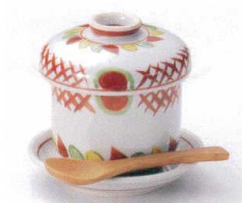
テ111-18 日輪むし碗 φ7.8×9cm 2,150円