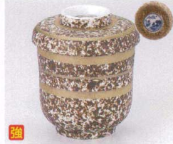
ア111-16 金彩吹山水小吸碗 φ6.9×8.8cm 2,200円