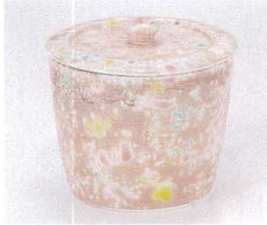
ミ111-01 金彩雫むし 7.6×7.3cm 2,700円