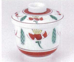
ト111-13 錦梅花むし碗 φ7.5×8.5cm 2,250円