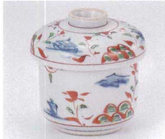
テ111-06 山水万暦むし碗 φ7.8×9cm 2,400円