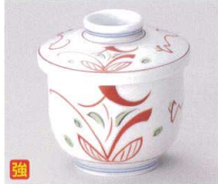
カ111-14 手描き京小花むし碗 φ7.8×8.8cm 2,200円