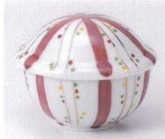
ミ111-09 袖裏紅水玉十草蓋物 9.6×8.5×8cm 2,300円