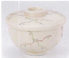
ホ111-26 美濃路大むし碗 φ11×9cm 1,900円