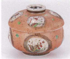
ツ111-02 朱巻むしの丸紋丸むし碗 φ8.6×7cm 2,650円