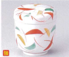
ウ111-07 唐草ハケメ夏目型蒸碗 φ8×8.2cm 2,440円