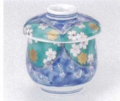
ト111-10 濃グリーン交趾春秋むし碗 φ7×8.8cm 2,300円