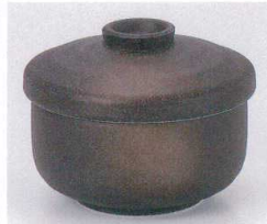
テ111-30 備前風大むし碗 φ10.4×8cm 850円