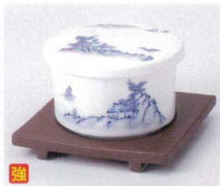
口111-33 山水セイロ蒸し器 φ9.9×6cm 1,400円