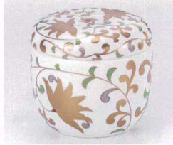
ト111-03 白マット金唐草むし碗 φ8×7.4cm 2,650円