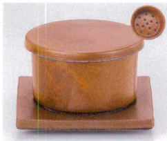
口111-31 茶マット蒸し器 φ9.9×6cm 1,400円