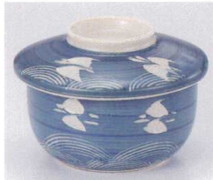
ホ111-29 千鳥平むし碗 φ10.3×8cm 1,150円