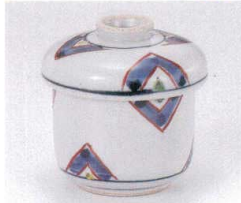
テ111-22 幾可紋むし碗 φ7.5×8.5cm 2,150円