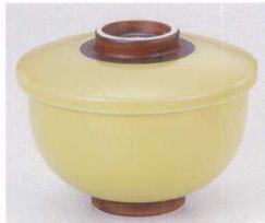
ト111-28 イエロー大蒸し碗 φ11×8.8cm 1,450円