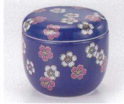
ツ111-05 紅白梅夏目型むし碗 φ8×7.5cm 2,450円