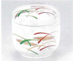
オ112-23 武蔵野夏目むし碗 φ7.7×8cm 1,850円