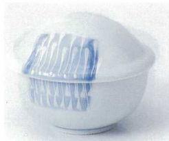
ト112-28 せせらぎ姫むし碗 10.5×9.3×7.3cm 1,800円