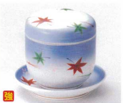
ワ112-08 銀彩春秋夏目むし碗 φ7.8×8cm 2,100円 ワ112-09 銀彩春秋新丸3.0皿 φ1.3×1.8cm 770円