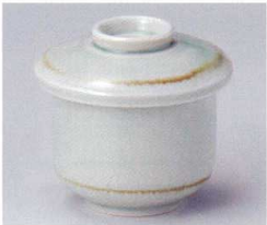
ト112-35 翠玉むし碗(大) φ8×8.9cm 1,550円