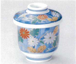
ツ112-24 染錦あけぼの菊むし(小) φ7×9.1cm 1,850円