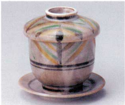
ミ112-12 古城むし碗 φ8×6.7cm 2,000円 ミ112-13 古城受皿 φ12.5×1cm 650円