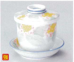
ワ112-36 ほのか京型むし碗 φ7.5×8.5cm 1,530円 ワ112-37 ほのか13cm丸皿 φ12.4×2.7cm 630円