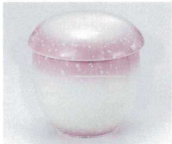
ミ112-29 ピンク白吹玉むし碗 φ8.5×8cm 1,800円