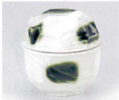
ト112-11 織部刷毛目むし碗 φ9×8.6cm 2,000円