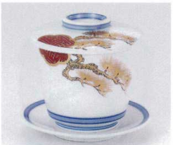
オ112-06 金彩松むし碗 φ8×7.2cm 2,110円 オ112-07 受皿 φ10.3cm 490円