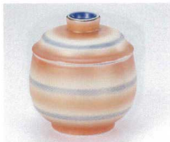
ト112-01 金彩二色吹むし碗 φ7.5×9cm 2,150円