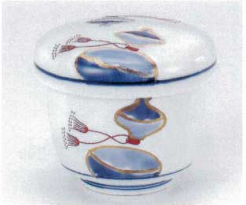
ト112-25 飄むし碗 φ7.5×7.5cm 1,850円