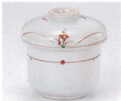
テ112-02 赤絵草紋むし碗 φ7.5×8.5cm 2,150円