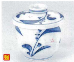
カ112-33 清里京型むし碗 7.5×8.4cm 1,600円