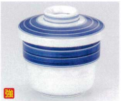
カ112-20 古染濃筋スタックむし碗 φ8.6×9cm 1,900円