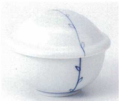
ツ112-30 若芽結び姫むし碗 10.5×9.5×8cm 1,700円