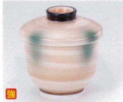
ツ112-22 オレンジ巻グリーン吹京型むし碗 φ7.6×8.5cm 1,870円