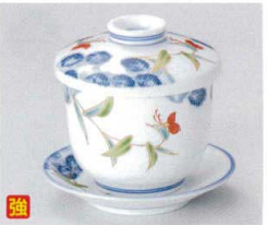
ワ112-38 つゆ草むし碗 φ7.5×8.3cm 1,500円 ワ112-39 つゆ草丸3.0皿 φ9.8×1.8cm 500円