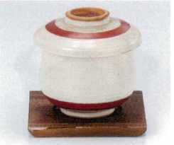
カ112-26 灰釉明日香ひさご型むし碗 φ8.3×9cm 1,800円 カ112-27 むし焼杉台 10×10cm 330円