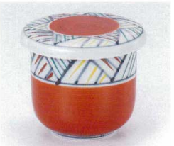
ト112-32 アジロ赤むし碗 φ8.9×8cm 1,700円