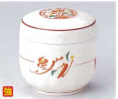
ホ112-21 赤絵みのり夏目むし碗 φ7.8×7.8cm 1,900円