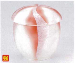
ツ112-14 銀彩ねじりむし碗(大) φ8.3×8.5cm 2,050円