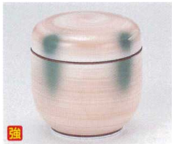
ツ112-18 オレンジ巻グリーン吹夏目型むし碗 φ7.8×7.6cm 1,980円