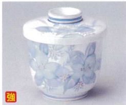
カ112-34 津和野むし碗 φ8×9.5cm 1,550円