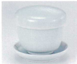
ネ112-16 青白磁むし碗 φ8.7×7・身φ7.7×6.5cm 1,950円 ネ112-17 青白磁むし碗合皿 φ9.2cm 650円