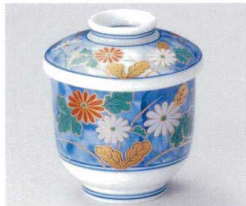
ツ112-10 染錦あけぼの菊むし(大) φ8×9.8cm 2,050円