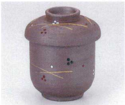
ウ112-19 南蛮むさし野むし碗 φ7.2×9.6cm 1,900円