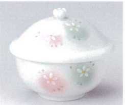
ミ112-15 二色吹小花むし碗 9.6×8.3×9cm 2,000円