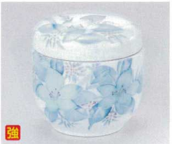
カ112-31 津和野夏目型むし碗 φ8×9.4cm 1,600円