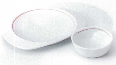
M121-08 白朱線天皿 22.5×18×2.7cm 1,650円 M121-09 白朱線結びとんすい 10.5×10.3×3.7cm 830円