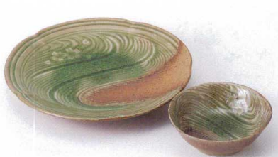
H121-26 織部清流7.0皿 φ22.5×4cm 1,320円 H121-27 織部清流4.0鉢 φ11.8×4.2cm 420円