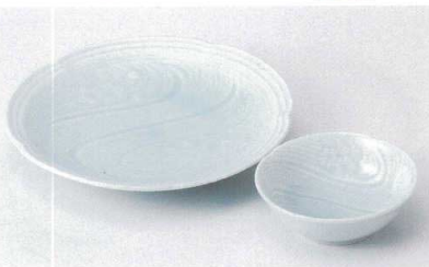
N121-20 清流丸7.0皿 φ21cm 1,400円 N121-21 清流丸とんすい φ11.5×4cm 560円