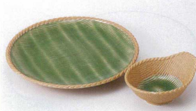
H121-31 かごめ8.0皿 φ24.5×3cm 1,270円 H121-32 かごめ7.0皿 φ21.5×3cm 1,100円 H121-33 かごめとんすい 13×8.5×5.3cm 700円