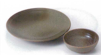
A121-16 若草丸7.0天皿 φ22.5cm 1,450円 A121-17 若草丸とんすい(松花堂兼用) φ11.7×4cm 450円