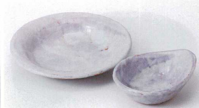
T121-28 あけ紫6.0深皿 φ19.5×3.2cm 1,280円 T121-29 あけ紫5.5深皿 φ16.5×3cm 1,100円 T121-30 あけ紫とんすい 14.5×11.5×4cm 1,180円