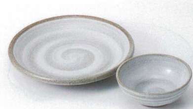
T121-18 唐津白ハケウず6.5天皿 21×3.5cm 1,400円 T121-19 唐津白ハケウずとんすい 11.5×4.5cm 740円