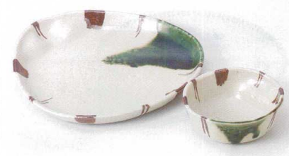
M121-10 サビ十草結び前菜皿 21×20.8×2cm 1,600円 M121-11 サビ十草結び小鉢 10.7×10.5×4cm 920円