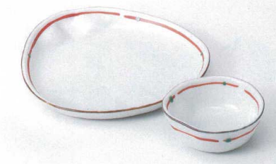
M121-12 朱つなぎ十草結び天皿 21×20.8×2cm 1,600円 M121-13 朱つなぎ十草結びとん水 10.7×10.5×4cm 920円