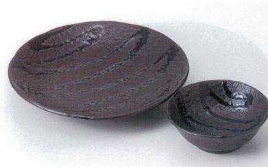
U121-24 黒織部流し天婦羅皿 21.9×3.7cm 1,320円 U121-25 黒織部流しとんすい 12.2×4.2cm 570円