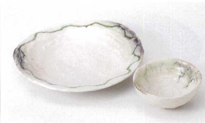
O121-22 窯変石目天皿 24×23×4cm 1,370円 O121-23 窯変石目とんすい φ11.8×5cm 620円