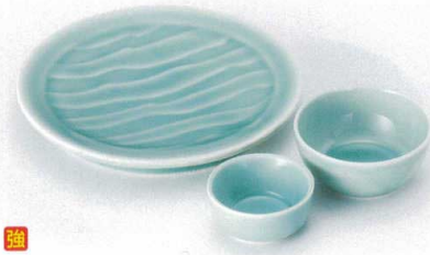
T121-05 深海青磁波彫6.3皿 φ19×2.3cm 1,700円 T121-06 深海青磁丸とんすい φ8.9×4cm 660円 T121-07 深海青磁丸千代口 6.6×3cm 420円