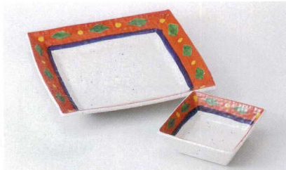
M121-03 朱巻菱紋正角天皿 21×21×3cm 1,700円 M121-04 朱巻菱紋正角とんすい 10.2×10.2×3.5cm 800円