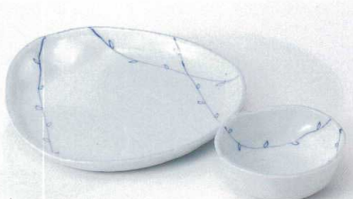
T121-14 若芽結び天皿 21×20×2.5cm 1,500円 T121-15 若芽結びとんすい 10.5×4cm 750円