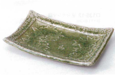
ミ136-11 春秋彫灰釉長角皿 25.3×16×4cm 2,200円