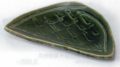
ミ136-03 織部半月三角紋盛皿 27.5×16.5×4cm 3,100円