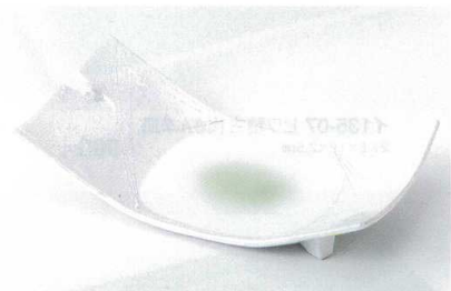
ツ136-10 一珍ラスターヒワ吹8.5焼物皿 26.3×13.4×5.3cm 2,250円