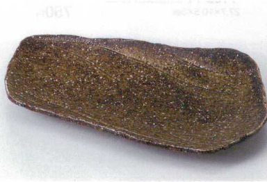
ネ136-15 荒磯焼物皿 27.0×17.0×3.0cm 1,300円