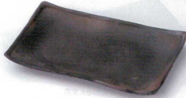
×136-02 炭化8.0長方皿 24×15×2.5cm 3,300円