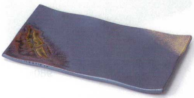
ネ136-04 いぶし金彩焼物皿 23.5×13×2.2cm 3,000円