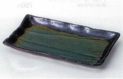
ネ136-16 黒環珞トルコブルー削ぎ焼物皿 24.3×14.3×2.4cm 960円