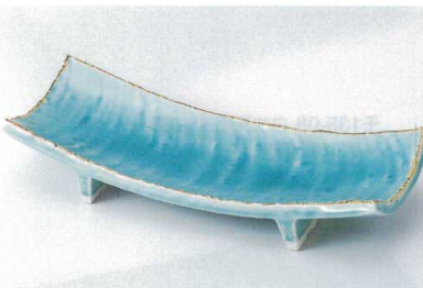
ツ136-09 青彩釉長角皿 27.8×10.8×5.6cm 2,200円