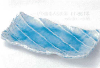
ツ136-12 マリンブルーガタ彫焼物皿 17.2×15.5×4.4cm 2,200円