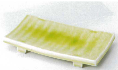
カ136-06 ヒワ軸マナ板大盛皿 26.7×14×3.6cm 2,350円 カ136-07 ヒワ軸マナ板焼物皿 21.2×11.6×3.3cm 1,700円