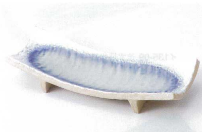
ト136-08 白タタキ藍流し長角皿 28×11×5.5cm 2,500円