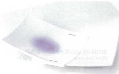
ト136-05 バイオレット吹重皿 30×15.5×4.3cm 2,850円