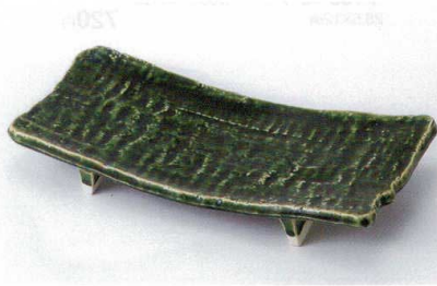
ト136-14 織部まな板焼物皿 25×11.8×4.1cm 2,500円