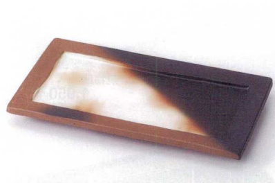
ミ137-08 備前風長角皿 22.5×12.6×2.5cm 2,000円