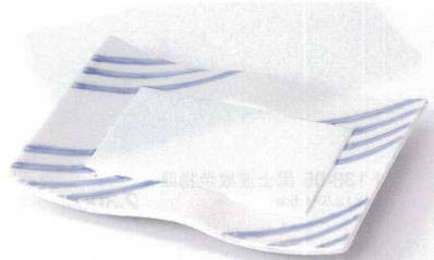
ミ137-05 ブルー線ラスターウエーブ焼物皿 21×15.7×3cm 2,400円