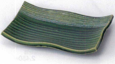
ミ137-01 ヒダ織部焼物皿 22×12.5×3.2cm 3,450円