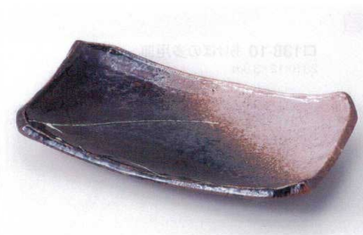
ツ137-12 津軽焼物皿 24×14×4.5cm 1,350円