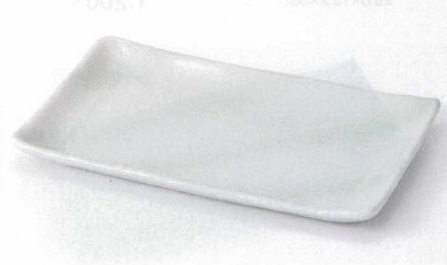
ホ137-15 グリーン吹焼物皿 24×14.5×1.5cm 770円