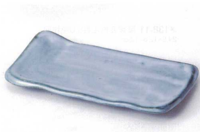
ロ137-11 よもぎ9.0焼物皿 24.8×12.2×3.2cm 1,400円