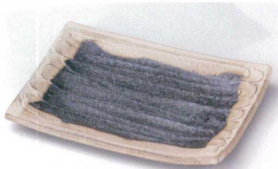
×137-04 黒窯変掛け分けソギ7.0長角皿 21×15.5×2cm 2,750円