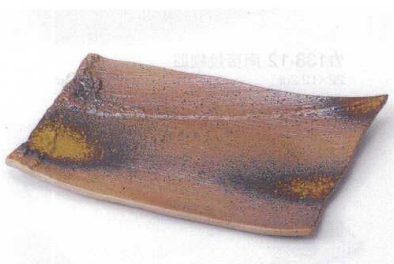
ウ137-10 美膳しぶぎ焼物皿 23.4×15.8×1.2cm 1,500円