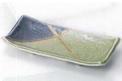
ア137-07 若草金彩四つ足長角皿(大) 23.3×11.2×4.2cm 2,200円