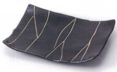
カ137-13 黒釉金線四ツ足焼物皿 21.7×16.5×3.5cm 1,320円