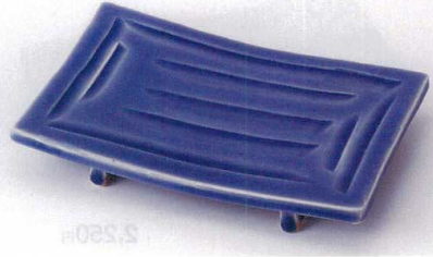
ミ137-02 青釉ソギまな板焼物皿 21.8×14.2×4.8cm 3,200円