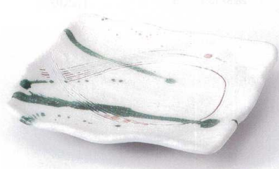
カ137-14 粉引串目結び四ツ足大皿 20×18×3.3cm 1,200円