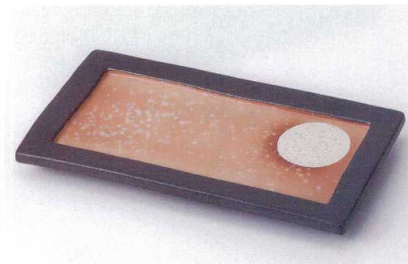
ト137-09 黒土満月突出皿 22.5×12.3×2.2cm 2,000円