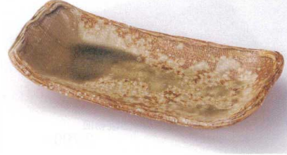
×137-03 灰釉足付長方皿 25×11.5×4cm 3,000円