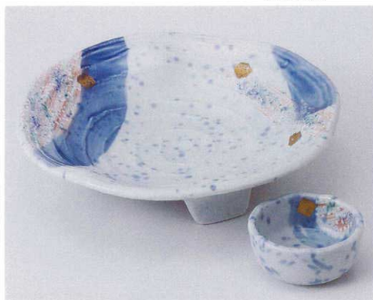
ト014-19 青白マット三色吹向付 φ20.5×5.4cm 3,450円 ト014-20 青白マット三色吹千代口 φ6.7×3.1cm 920円