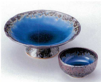
マ014-09 南蛮ルリ 高台向付 15×5.5cm (有田焼) 3,000円 マ014-10 南蛮ルリ 千代口 7.5×3.5cm (有田焼) 1,200円