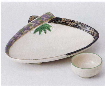
テ014-03 ムスピクリーム向付 22.5×14.5×6.7cm 3,600円 テ014-04 クリーム丸千代口 φ7×3.4cm 1,050円