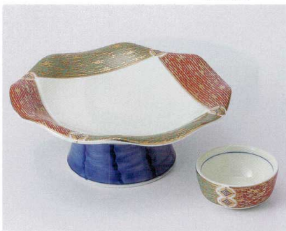
ミ014-21 金彩十草高台向付 φ18×6.8cm 3,000円 ミ014-22 金彩十草千代口 φ6.6×3cm 880円