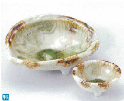
ミ014-23 灰釉アワビ向付 16.2×13.5×5.7cm 2,300円 ミ014-24 灰釉アワビ丸千代口 φ7.5×3.5cm 800円