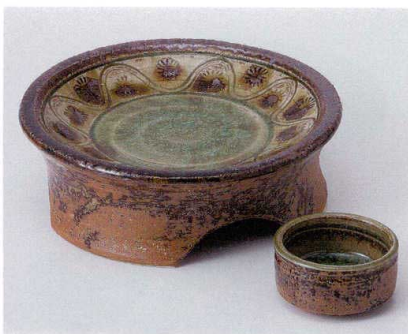
ツ014-05 美濃伊賀アラビア文様高台5.5刺身 17.3×5.8cm 3,950円 ツ014-06 美濃伊賀丸千代口 φ6.2×3.4cm 740円