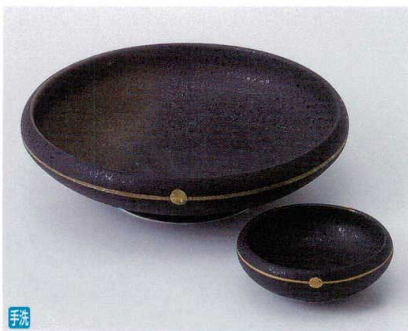
ミ014-17 金彩焼締め鉄鉢向付 φ15.2×4.1cm 3,100円 ミ014-18 金彩焼締め鉄鉢千代口 φ6.8×2.4cm 1,000円