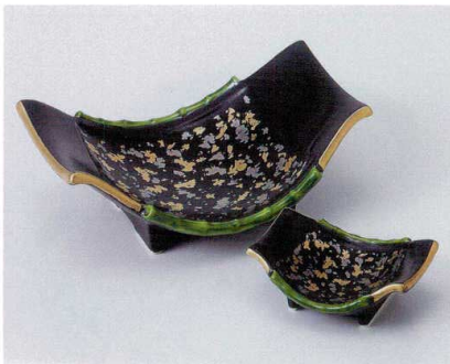
ト014-11 舟型金銀ちらし刺身鉢 20×14.3×7cm 3,300円 ト014-12 舟型金銀ちらし千代口 10×8×3.8cm 1,200円