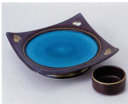
カ014-01 南蛮トルコ高台皿 17×17×5cm 3,600円 カ014-02 南蛮トルコ丸千代口 φ6.2×3cm 680円