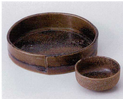
ト014-07 嵐山刺身鉢 φ17.5×4cm 3,700円 ト014-08 嵐山千代口 φ7.7×3.5cm 350円