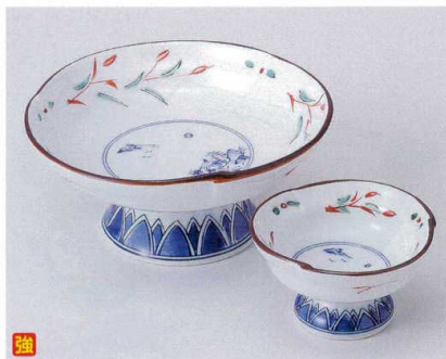
カ014-13 赤絵京山水刺身 φ15×7cm 3,350円 カ014-14 赤絵京山水千代口 φ8.5×5cm 1,250円