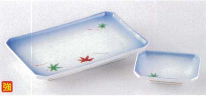
フ143-08 銀彩春秋四ツ切8.0焼物皿 21.5×14.5×H2.7cm 2,520円 フ143-09 銀彩春秋四ツ切千代口 10.5×6.9×H2.7cm 950円