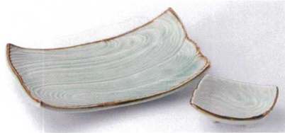
ト143-01 翠玉流水8.0焼物皿 21.6×13.2×4.1cm 2,700円 ト143-02 翠玉流水長角小皿 9.4×7.2×3.3cm 620円