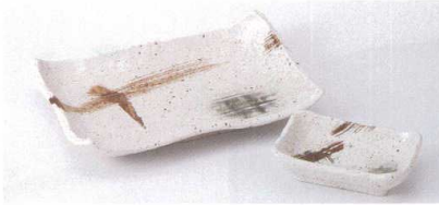
ヤ143-29 みやま測波焼物皿 21×14×4cm 730円 ヤ143-30 みやま銘々皿 16×11×3cm 520円 ヤ143-31 みやま角千代口 10.7×7×3cm 380円