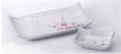
オ143-18 野書紅梅焼物皿 22×12×4cm 1,340円 オ143-19 野書紅梅長角千代口 10×7×3.5cm 860円