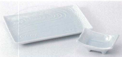
ホ143-20 青白磁清流焼物皿 22×14cm 1,320円 ホ143-21 青白磁清流長角千代口 9.5×6.7×3.5cm 480円