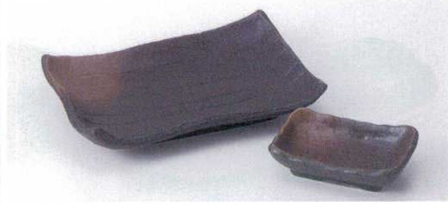
ヤ143-32 新黒備前測波焼物皿 20.5×14.3×4cm 730円 ヤ143-33 新黒備前角千代口 10.5×7×3cm 340円