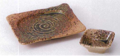
ア143-34 南蛮織部角焼物皿 18.5×15×2.7cm 800円 ア143-35 南蛮織部角千代口 8×3.3cm 350円