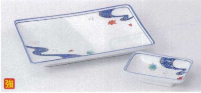
フ143-10 流水焼物皿 21.2×14.2×2.6cm 2,050円 フ143-11 流水角千代口 10.3×6.7×2.6cm 770円