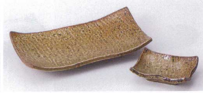
タ143-38 田園浜付焼物皿 19.5×10×3.3cm 660円 タ143-39 田園角千代口 8.8×6.2×2.7cm 340円