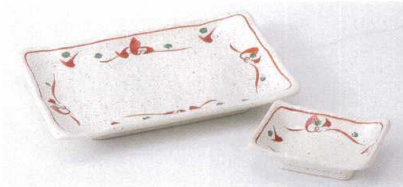
ヤ143-22 唐津赤絵焼物皿 21.5×14.5cm 1,030円 ヤ143-23 唐津赤絵角千代口 10×7.3cm 480円