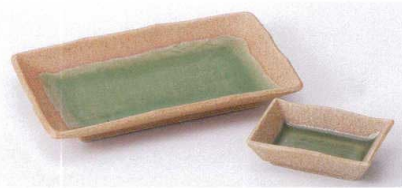
イ143-26 ヒワ釉古代7.0焼物皿 21×13.3×2.5cm 780円 イ143-27 ヒワ釉古代6.0焼物皿 18.5×13×2.5cm 680円 イ143-28 ヒワ釉古代角千代口 9.8×6.5×2.2cm 400円