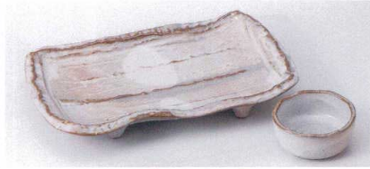
イ143-06 粉引御本手まな板皿 22.5×14×3.5cm 2,200円 イ143-07 粉引御本手丸千代口 φ7×3.5cm 750円