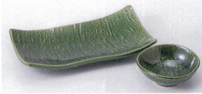
ア143-36 織部焼物皿 19.8×10.5×3.8cm 700円 ア143-37 織部千代口 9×8.5×3.5cm 350円