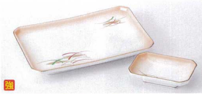
カ143-03 加茂川8.0焼物皿 21.5×14.5cm 2,700円 カ143-04 加茂川四ツ切7.0焼物皿 19×11.9cm 2,350円 カ143-05 加茂川四ツ切千代口 10.8×6.8cm 970円