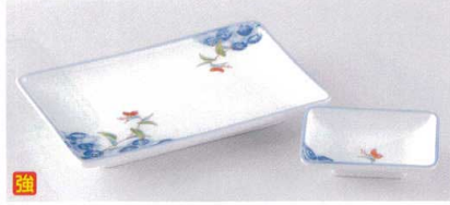
フ143-12 つゆ草焼物皿 21.2×14.2×2.6cm 2,050円 フ143-13 つゆ草角千代口 10.3×6.7×2.6cm 780円