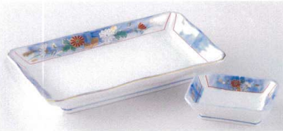
ツ143-14 染錦あけぼの菊焼物皿 22.6×13×3.5cm 1,750円 ツ143-15 染錦あけぼの菊角千代口 9.8×7.1×2.9cm 800円