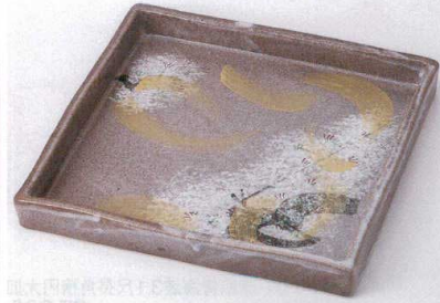
カ149-04 乾山春秋切立8.0盛皿 24.5×24.5×3cm 4,500円