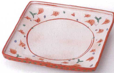
カ149-03 粉引赤絵花唐草正角9.0盛皿 27.9×27.9×5.2cm 4,500円