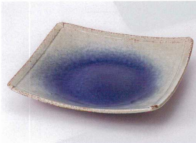
ア149-12 瑠璃角大皿 25×25×4.8cm 1,800円