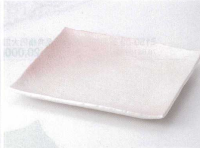
ヤ149-11 桜志野正角大皿 29.5×26×3.6cm 2,960円