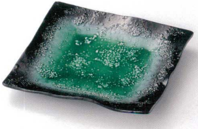
タ149-01 エメラルドグリーン華正角大皿 26.5×25.4×4cm 4,800円 タ149-02 エメラルドグリーン華正角皿 18×17.5×2.8cm 1,000円