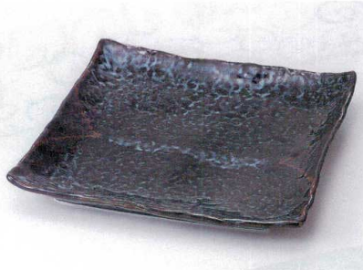
キ149-10 山がすみ石目9.0正角皿 27×27×3.5cm 3,200円