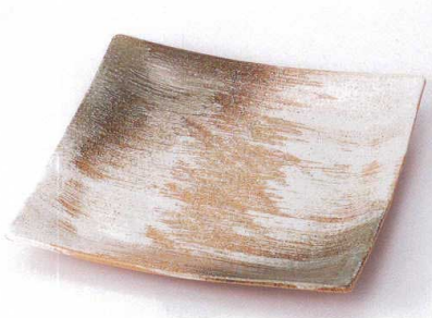
ホ149-05 刷毛目おりべ尺二角皿 28.5×28.5×4cm 3,850円