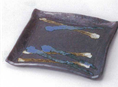
ヤ149-07 黒三彩正角大皿 27.5cm 3,400円