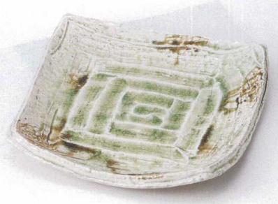
ト149-06 ビード口四角盛皿 28.5×27.5×4.3cm 3,600円