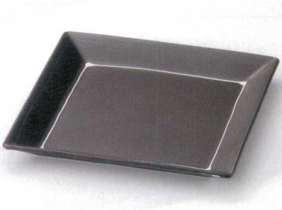
モ149-13 一珍新黒マット四方大皿 25.5×25.5×2.7cm 2,500円 モ149-14 一珍新黒マット四方長バスタ 22×22×2.7cm 1,700円 モ149-15 一珍新黒マット四方ケーキ 19.5×19.5×2.8cm 1,150円