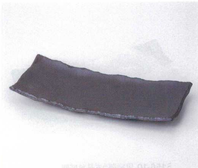
ツ155-15 荒黒長角大盛皿 35.7×15.3×3.5cm 2,850円