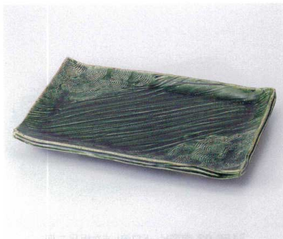
ミ155-01 織部波紋彫足付大盛込皿 35.5×23×6.3cm 13,000円