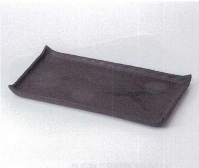
ト155-02 炭化尺四盛皿 41×21×3.2cm 8,000円