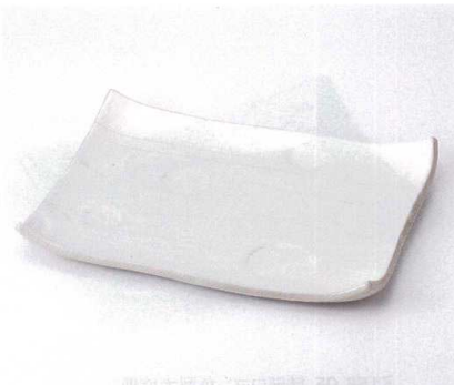
オ155-07 ストライプ長角大皿 6,600円 オ155-08 ストライプ中盛皿 3,850円