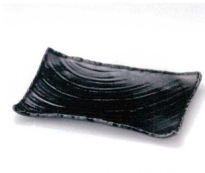
ト155-04 柚子天目枯山水 角皿 大 6,000円 ト155-05 柚子天目枯山水 角皿 中 4,600円 ト155-06 柚子天目枯山水 角皿 小 2,800円