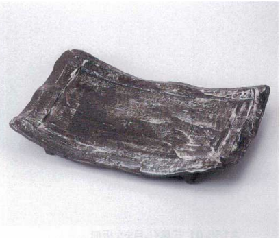
カ155-03 炭化土白化粧尺2寸盛皿 35.7×24.5×3.5cm 7,000円