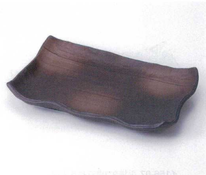
キ155-12 黒備前長角大皿 33.8×21.7×5.5cm 3,740円