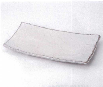
ツ155-11 御本手櫛目長角尺二皿 37.5×21.5×4.5cm 3,800円