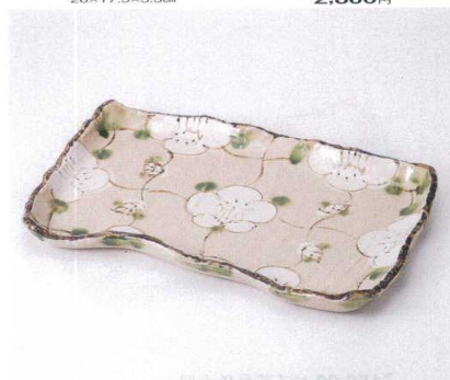
ツ155-10 格子花変形長角皿 37×24.5×3.5cm 4,750円