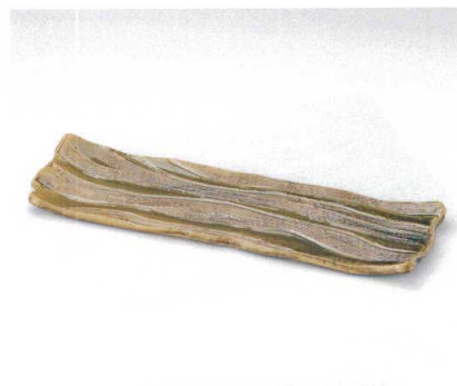
ホ155-13 織部クシメ長盛皿 44×13.5cm 3,500円