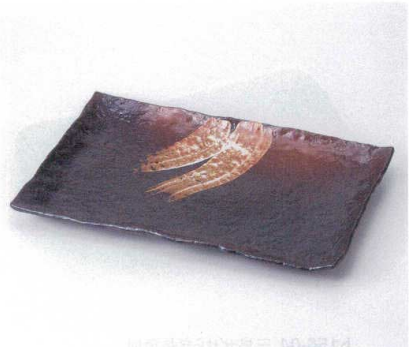
ネ155-09 白刷毛唐津12.0長角皿 36.2×24.0×3.4cm 5,800円