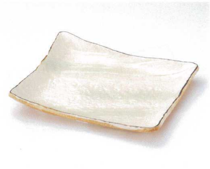
ネ156-08 安曇野角大皿 30.5×24.5×5cm 3,200円