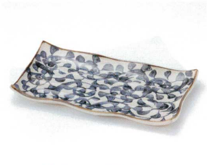
イ156-07 手描タコ唐草長角大皿 35.5×19.5×4cm 3,380円