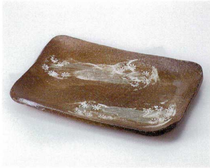
ト156-04 三鳥せせらぎ長角皿 33.3×25.2×2.5cm 4,000円