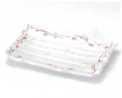
ミ156-09 つる花長角大皿 33×21×3.2cm 3,100円