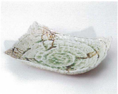
ト156-06 ビードロ四方上り長角鉢 30.7×23.5×7.7cm 3,400円