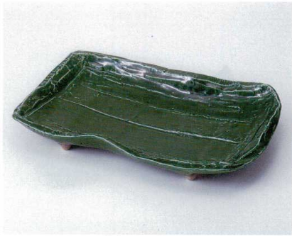
ツ156-02 織部尺二盛込皿 35.5×22.7×5.5cm 8,200円