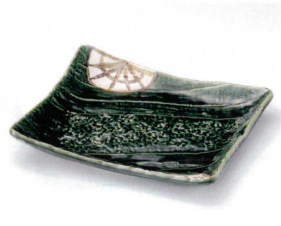
ミ156-05 織部ロマン角型大盛皿 30.5×25.5×4.7cm 3,900円