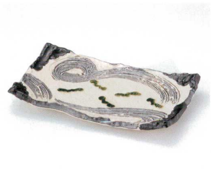
ミ156-10 黒織部うず長角盛皿 32×19.5×4.5cm 3,000円