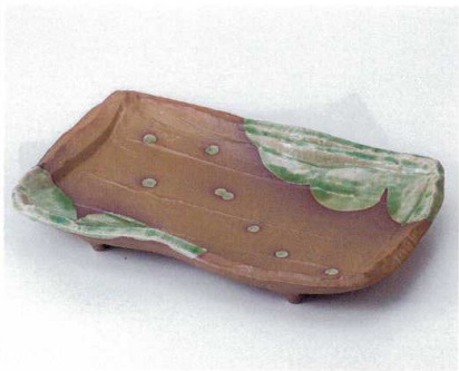
ミ156-03 南蛮ビードロ流しまな板尺二皿 35.7×23×6cm 7,500円