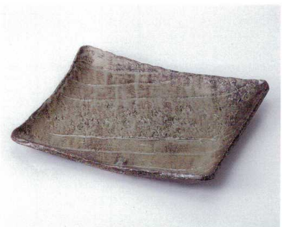
ネ156-11 越前角大皿 29.7×24.7×4.3cm 3,000円