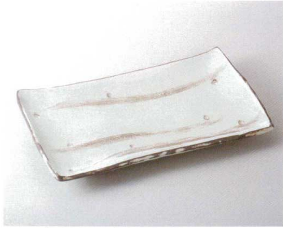
ネ156-01 三鳥くし目まな板皿 36.5×22.0×4.5cm 12,800円