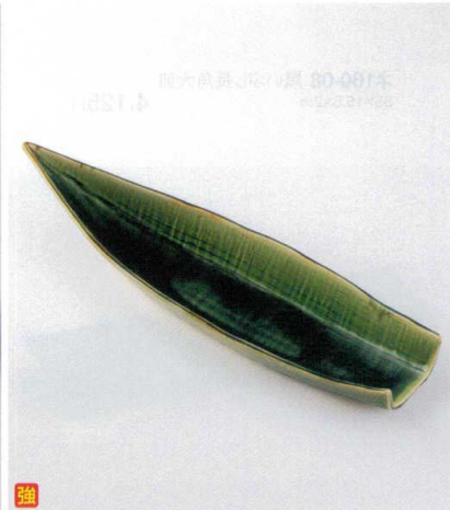
ト159-16 オリーブ舟型長皿 44.5×12×7cm 3,600円