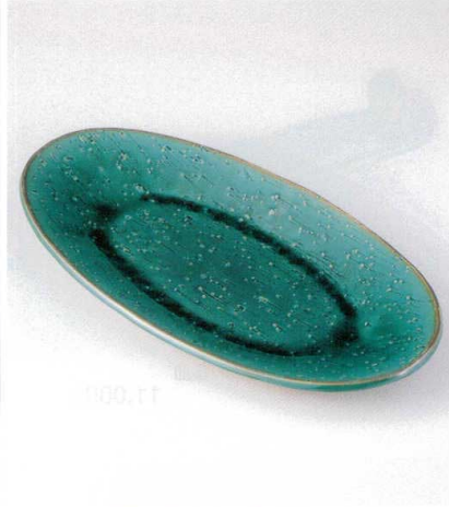
×159-04 緑釉16.5楕円皿 47.5×25×4.5cm 8,500円