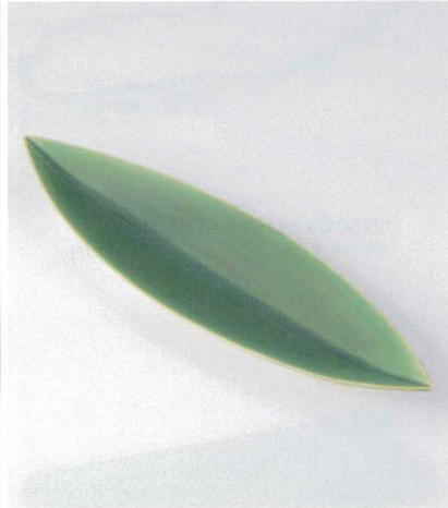
オ159-11 笹型大皿グリーン 52.4×15×4.2cm 6,800円 オ159-12 笹型中皿グリーン 44×10.5×2.8cm 3,400円 オ159-13 笹型小皿グリーン 30.3×7.5×2.7cm 860円