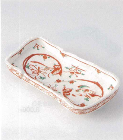
ツ159-01 粉引赤絵長角尺二盛皿 38×16.5×8cm 9,500円