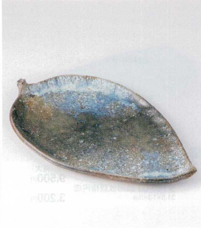
×159-02 焼締ピードロ16.0葉形皿 48.5×29×4cm 8,800円 ×159-03 焼締ピードロ13.0葉形皿 41×24×3.5cm 6,400円