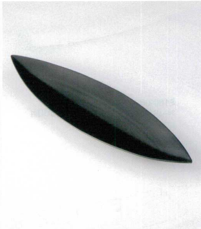
オ159-08 笹型大皿黒 52.4×15×4.2cm 6,800円 オ159-09 笹型中皿黒 44×10.5×2.8cm 3,400円 オ159-10 笹型小皿黒 30.3×7.5×2.7cm 860円