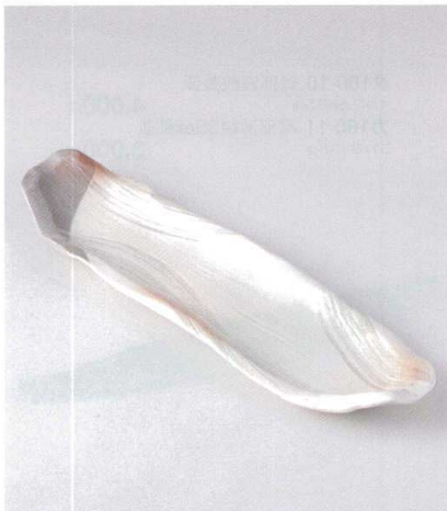
タ159-14 白灰流長盛皿 50.3×14×5cm 4,500円