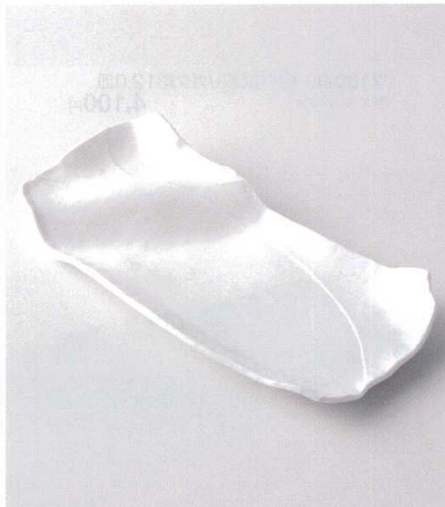
ア159-15 白釉盛込皿大 39×19×6.5cm 4,200円