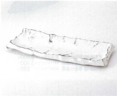
ツ160-09 粉引拭取りガタ彫12.0皿 37×14.5×4cm 4,100円