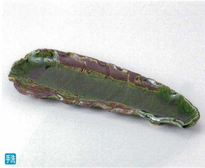
テ160-02 織部波紋(手造り)楕円皿(特大) 40×15.5×4cm 9,500円 タ160-03 織部波紋楕円皿 31.5×13×3cm 3,200円