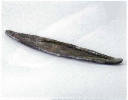
ネ160-14 手作り船形皿窯変織部 49.0×9.3×2.3cm 2,500円