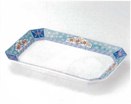
テ160-04 グリン花小紋高台長皿 30.2×20×3.5cm 8,000円