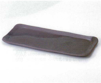
ネ160-08 黒いぶし長角大皿 35×15.5×2cm 4,125円