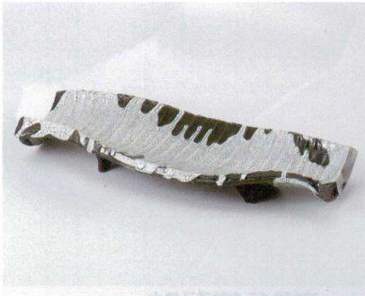
ツ160-13 カイラギうねり申目尺皿 34×13.5×5cm 2,650円