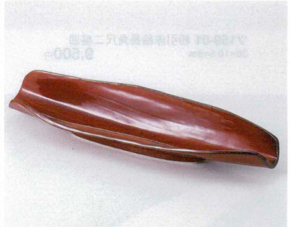
タ160-07 赤釉葉月 40×11×6.5cm 4,400円