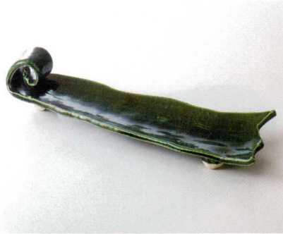
カ160-01 織部ひねり長皿 44×13.5×9.3cm 11,000円