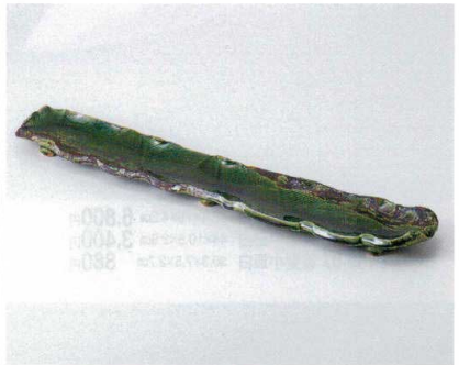
タ160-10 織部波紋長皿 47×7.5×3.5cm 4,000円 カ160-11 織部波紋35cm長皿 31×8×3.5cm 3,000円