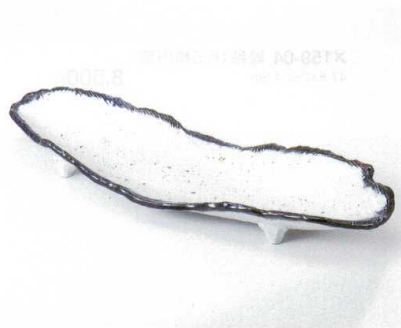
ツ160-05 かいらぎ呉須流櫛目長皿 43×14.8×5.2cm 5,100円