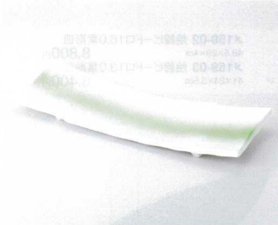
ミ160-06 ヒワ吹尺二ちぎり長角皿 36×12.7×4.2cm 4,600円