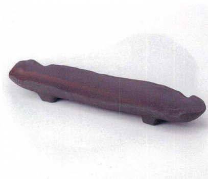
ト161-05 南蛮尺四長皿 41×11×6.5cm 4,300円