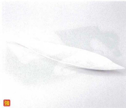
ト161-10 NBリーフ47皿 47×11×2.8cm 2,950円