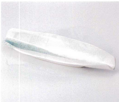
タ161-04 藍流し葉月 40×11×6.5cm 4,400円