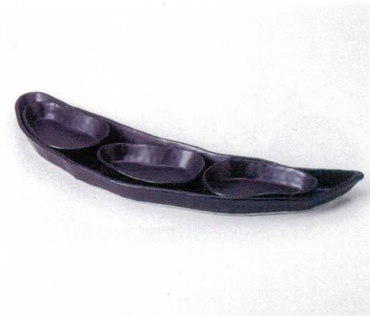
ホ161-15 黒リーフセット 3,740円 ホ161-16 黒リーフ大皿 43×11cm 2,000円 ホ161-17 黒リーフ小皿 12.5×8.5cm 580円