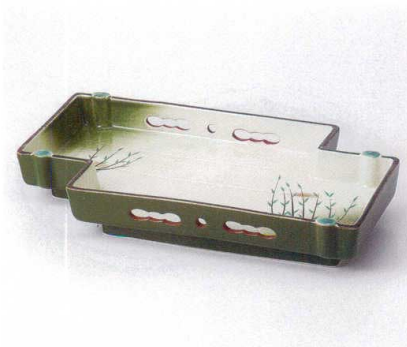
ミ161-01 京橋10.0盛鉢 31×17.5×4.7cm 7,500円