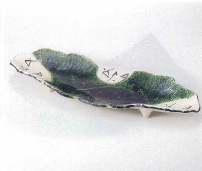
ア161-03 織部長盛皿 43×14.7×5cm 5,700円