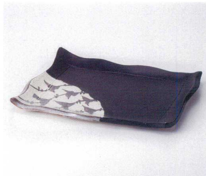
ミ161-06 黒織部モダンカット10.0長角皿 29.5×21.5×3cm 4,200円