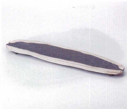
×161-02 黒窯変掛け分け変型長皿 41×10.5×3cm 6,800円