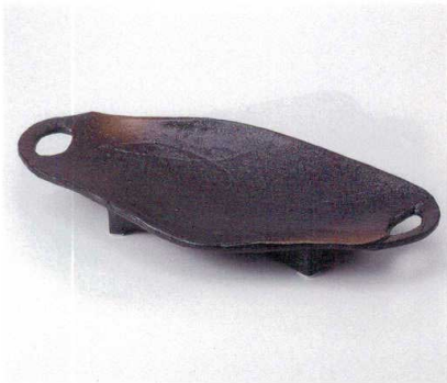
ヤ161-07 黒備前金茶吹き手付盛鉢大 40×20.5×4cm 3,800円 ヤ161-08 黒備前金茶吹き手付盛鉢小 34×16.5×3.8cm 2,330円