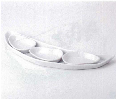
ホ161-12 白リーフセット 3,740円 ホ161-13 白リーフ大皿 43×11cm 2,000円 ホ161-14 白リーフ小皿 12.5×8.5cm 580円