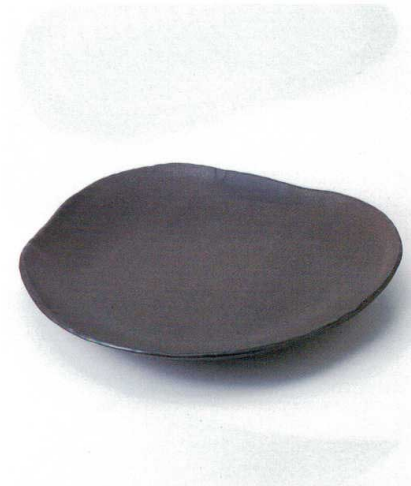
タ164-05 窯変黒16吋三方角皿 41×40.5×6.5cm 12,000円