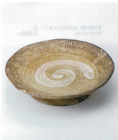
イ164-08 粉引高台尺寸皿 φ30.5×7.5cm 5,800円