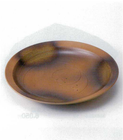
ホ164-02 南蛮尺二皿 φ37cm 15,700円 ホ164-03 南蛮尺皿 φ31.5cm 7,850円