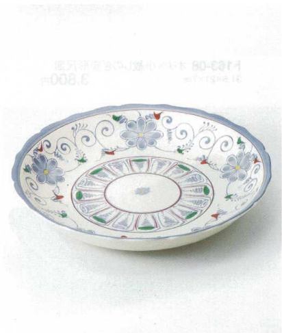
カ164-09 安南(アンナン)桔梗型尺皿 φ31.5×6cm 5,700円