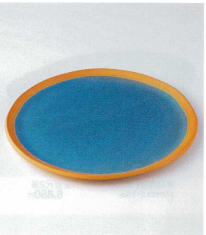
×164-04 火色内トルコ青14.0大皿 φ42×2.2cm 17,600円