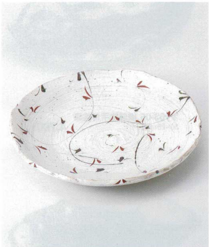
ホ164-06 刷毛目唐草タタラ大皿 φ33×5cm 12,000円