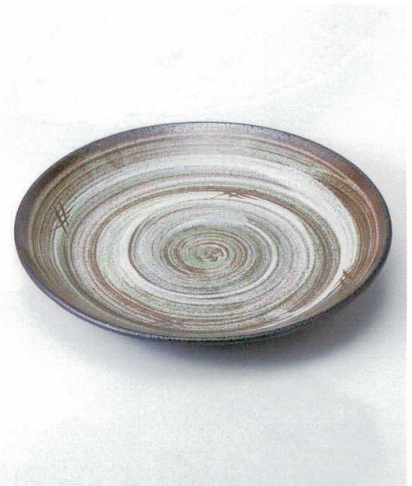
テ164-07 粉引井桁尺皿 φ30×4.5cm 5,700円