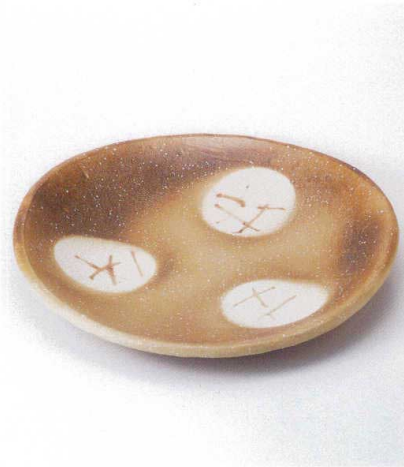
×165-03 焼 ろ 15.0大皿 φ45×6cm 28,600円 ×165-04 焼 ろ 11.0大皿 φ33×5cm 11,000円