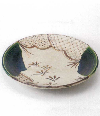
口165-02 織部七宝尺二皿 φ37.8×6cm 29,000円