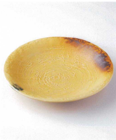
ト165-10 石目黄花尺皿 φ31.5×5.7cm 4,400円