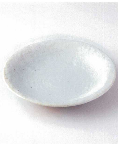
タ165-09 のどか石目尺皿 φ31.8×5.5cm 4,400円