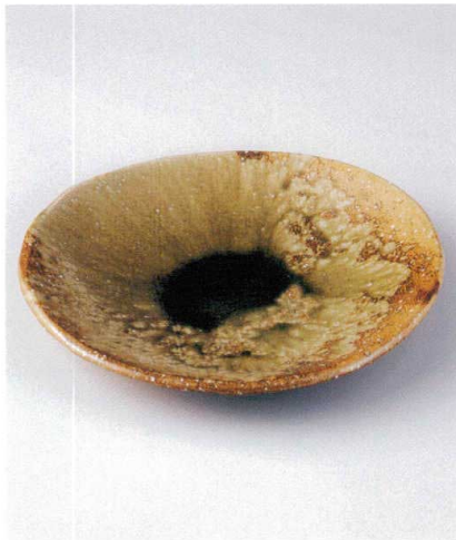
×165-05 灰釉11.0丸皿 φ34×3.5cm 10,450円