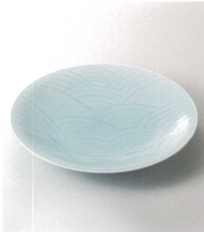
モ165-01 快山窯 青白磁波沢一皿 33.5×4.8cm 55,000円