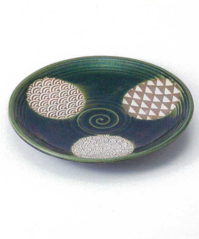
ア165-07 織部丸紋丸尺皿 φ31×4.5cm 4,950円