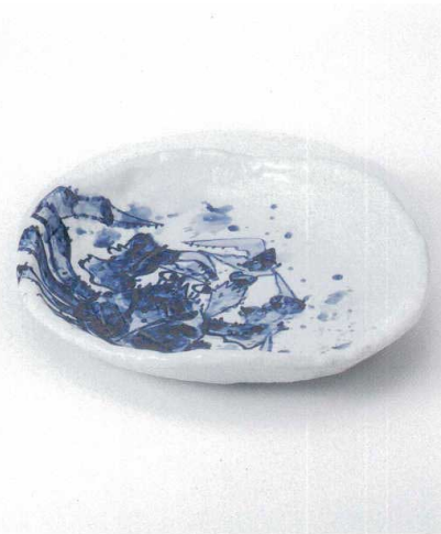
オ165-06 新カニ絵盛皿 31.5×29.5×6cm 5,150円