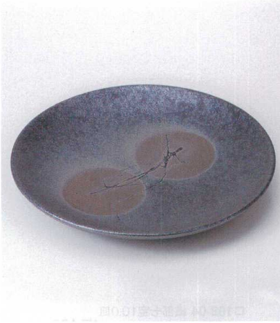
×167-03 黒窯変13.0ポタモ子丸皿 φ39×5cm 12,000円 ×167-04 黒窯変10.0ポタモ子丸皿 φ33×4cm 6,800円