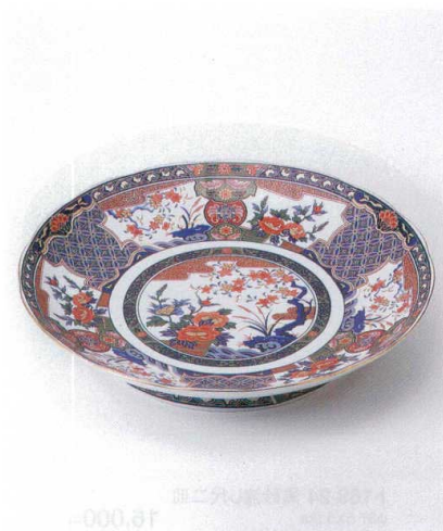
×167-10 垣根牡丹高台尺皿 φ31×5cm 4,290円