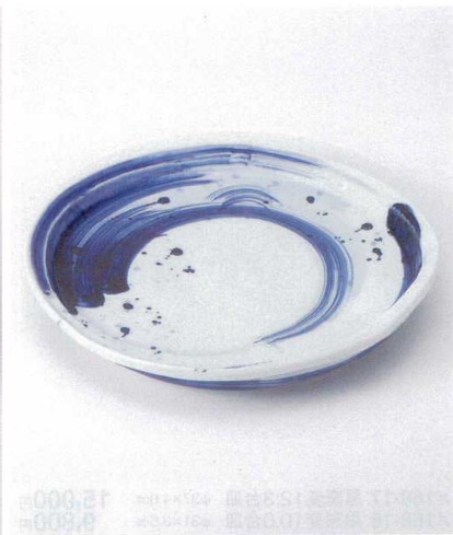
×167-12 ゴス刷毛変形尺皿 φ31×4cm 3,650円