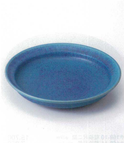
×167-08 トルコ青11.0丸鉢 φ33.5×6.5cm 9,800円