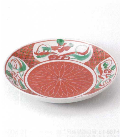
×167-07 万暦尺一皿 φ33.5×6cm 18,500円