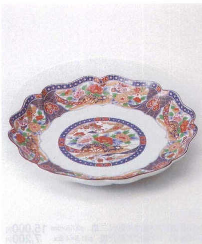
×167-11 平安錦尺大皿 φ31×4.2cm 4,100円