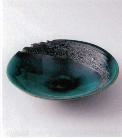
×167-05 緑釉13.7皿鉢 φ41×1.0cm 27,500円 ×167-06 緑釉11.0皿鉢 φ35×7cm 10,000円