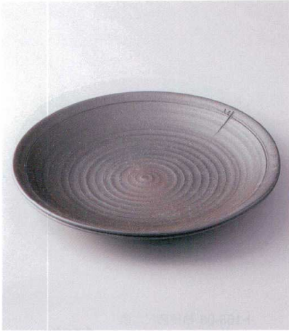
×167-01 炭化ロクロ目13.0大皿 φ39.5×6cm 14,800円 ×167-02 炭化ロクロ目11.0大皿 φ33×5.5cm 9,800円