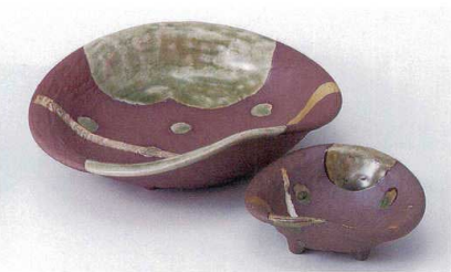
M017-27 南蛮銀河刺身鉢 16×14.3×4.5cm 2,200円 M017-28 南蛮銀河千代口 8.8×7.5×3cm 1,000円