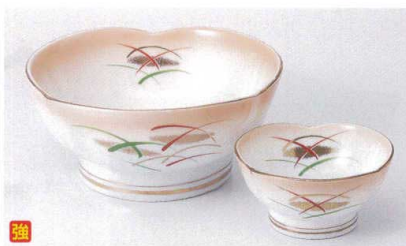
K017-05 加茂川三ツ山刺身鉢 φ15×7cm 2,600円 K017-06 加茂川三ツ山千代口 φ8.8×4.5cm 1,050円