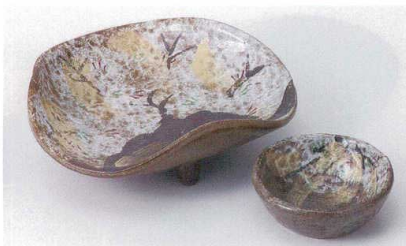
I017-11 唐津瓔珞木5.5皿 16.5×15.5×5.2cm 2,960円 I017-12 唐津瓔珞木千代口 φ8×2.7cm 1,000円