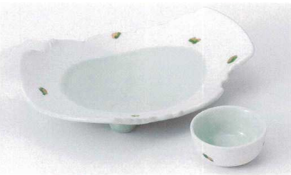
I017-21 銀彩ちぎり向付 21.5×16×5cm 2,200円 I017-22 銀彩ちぎり丸千代口 φ6.7×3cm 880円