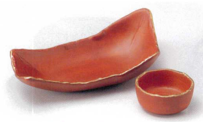
N017-19 測金朱塗向付 18.5×9.5×6cm 2,400円 N017-20 測金朱塗丸千代口 φ6.7×3cm 780円