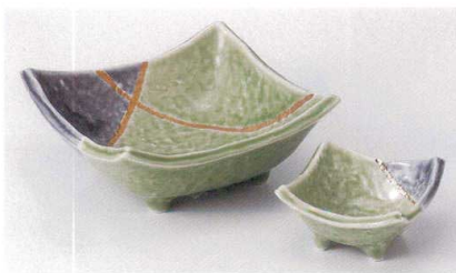
A017-01 若草金彩角鉢 14.7×14.7×6.5cm 2,850円 A017-02 若草金彩角千代口 8×8×4.3cm 800円