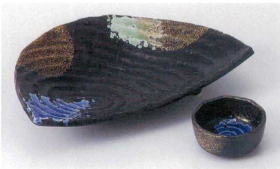
I017-23 黒釉三色吹半月向付 22×15.3×5.2cm 2,500円 I017-24 黒釉三色吹丸千代口 φ6.7×3cm 900円