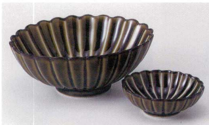
T017-07 利休織部菊割刺身鉢 16×13×6.2cm 2,850円 T017-08 利休織部菊割千代口 8.6×7.3×3.1cm 950円