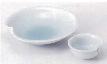
N017-03 青白磁耳付向付(大) 16.7×15.5×4.8cm 2,800円 N017-04 青白磁千代口 7.7×7×3.7cm 1,250円