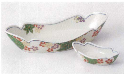
M017-13 舟型友禪向付 23.5×10×5.5cm 2,800円 M017-14 舟型友禪千代口 11.6×5.4×3cm 1,050円