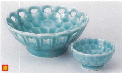
T017-25 深青海青磁透し刺身鉢 φ15.3×6.4cm 2,250円 T017-26 深青海青磁透し千代口 φ7.7×3.8cm 800円