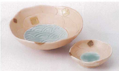
I017-09 金彩青海波刺身鉢 φ15.2×5cm 2,700円 I017-10 金彩青海波千代口 φ8.6×3cm 1,000円