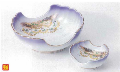
K017-17 安曇野二方切刺身鉢 13.6×12×5.1cm 2,500円 K017-18 安曇野二方切千代口 7.3×6.7×3cm 1,050円