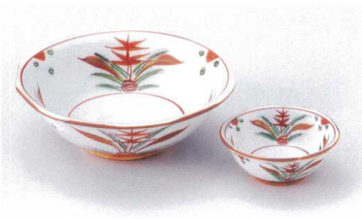
M017-29 赤絵三方花画刺身鉢 φ14.5×5cm 2,200円 M017-30 赤絵三方花画千代口 φ7.5×3cm 1,200円