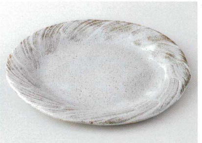
タ172-35 さざ波8.5皿 26.3×26×2.6cm 2,100円 タ172-36 さざ波7.0皿 21×20.5×1.7cm 1,400円 タ172-37 さざ波5.5皿 16.3×16×1.7cm 640円