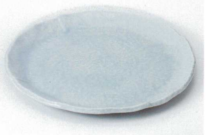
ロ172-09 青白釉9.0丸皿 φ28.5×2.6cm 3,000円 ロ172-10 青白釉7.0丸皿 φ21.4×2.4cm 1,500円 ロ172-11 青白釉6.0丸皿 φ18.3×2.4cm 840円 ロ172-12 青白釉丸銘々皿 φ13.2×2cm 650円