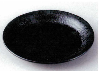
タ172-27 サガノ26cm丸皿 φ26×3.3cm 2,400円 タ172-28 サガノ20cm丸皿 φ19.5×2.6cm 1,000円