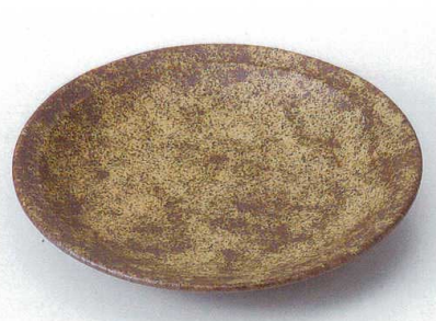
タ172-21 えき9.0皿 φ27.6×3.8cm 2,550円 タ172-22 えき8.0皿 φ24.6×3.3cm 2,000円 タ172-23 えき7.0皿 φ21.2×3.1cm 1,300円 タ172-24 えき6.0皿 φ18.5×2.5cm 880円 タ172-25 えき5.0皿 φ15.1×2.4cm 700円 タ172-26 えき4.0皿 φ13×2.2cm 600円