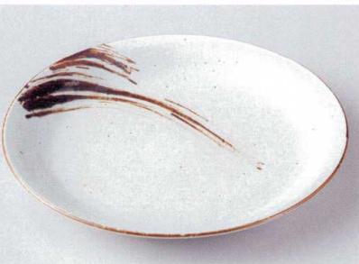
ウ172-19 錆刷毛目8.0丸皿 φ26.8×2.5cm 2,600円 ウ172-20 錆刷毛目6.0丸皿 φ19×2.4cm 1,380円