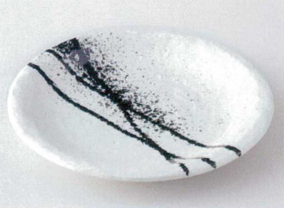
ハ172-13 吹あそび石目9.0皿 φ27.8cm 3,080円 ハ172-14 吹あそび石目7.0皿 φ22.5cm 1,150円