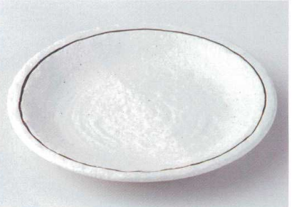
イ172-17 粉引石目9.0皿 φ27.8×3.6cm 2,800円 イ172-18 粉引石目7.0皿 φ23×3.5cm 1,050円