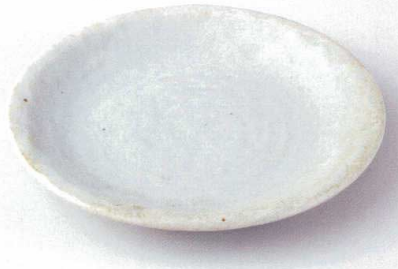
タ172-01 のどか石目9.0皿 φ28×3.3cm 3,200円 タ172-02 のどか石目8.0皿 φ25.2×3.3cm 1,800円 タ172-03 のどか石目7.0皿 φ22.9×3cm 1,200円 タ172-04 のどか石目6.0皿 φ19.7×2.8cm 780円 タ172-05 のどか石目5.0皿 φ16.3×2.2cm 600円 タ172-06 のどか石目4.5皿 φ14.2×1.8cm 530円