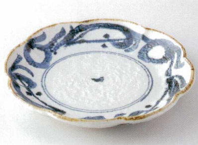
テ172-15 波唐草8.5皿 26cm 2,850円 テ172-16 波唐草7.0皿 23cm 2,200円