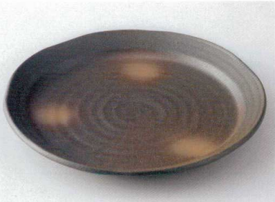
ウ172-29 備前風8.0皿 φ25.2×3cm 2,430円 ウ172-30 備前風7.0皿 φ22.6×2.8cm 1,940円