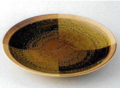
オ172-31 十字紋9.0皿 φ27.7×4cm 2,320円 オ172-32 十字紋8.0皿 φ24.5×3.8cm 2,300円 オ172-33 十字紋7.0皿 φ21.2×3cm 1,600円 オ172-34 十字紋6.0皿 φ18.5×2.7cm 1,150円