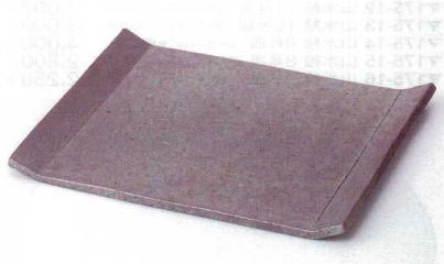
カ176-07 炭化スクエア-27プレート 27×22cm 4,900円