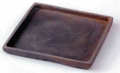
×176-01 炭化8.0角皿 24×24×2.5cm 7,600円