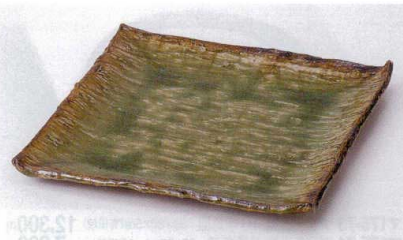
テ176-18 灰釉正角盛皿 23.5×23.5×2.5cm 3,800円