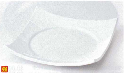
タ176-20 白磁8.5四方皿 26.5×5.3cm 3,800円