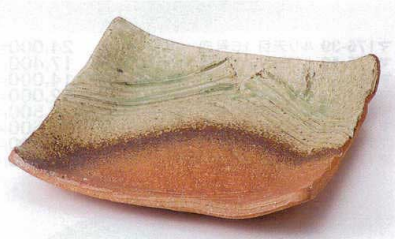
ト176-10 伊賀緑釉正角皿(手造り) 21.5×21×4cm 4,800円