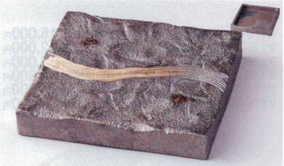
×176-12 黒窯変クン目6.8角皿 20.5×20.5×3cm 4,400円