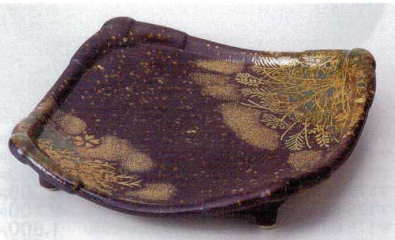
カ176-13 玉淵鑄巻武蔵野盛皿 22.3×22.3×4.6cm 4,400円