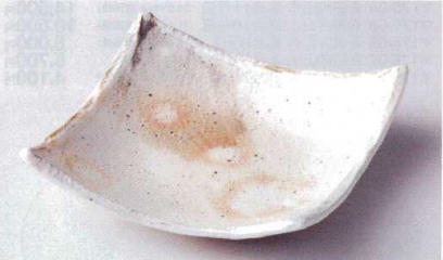
×176-08 あけぼの7.3角皿 21.7×21.7×5.5cm 4,800円 ×176-09 あけぼの6.3角皿 19×19×3.2cm 3,600円