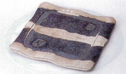
×176-03 黒窯変掛け分けソング8.2角皿 24.7×24.7×2cm 5,500円