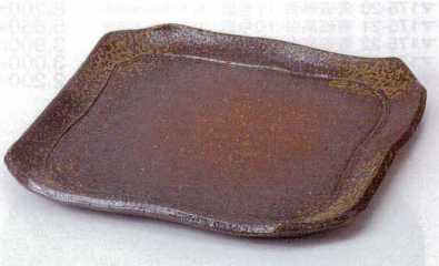
ミ176-06 手造り備前風角尺皿 25.4×25×2.6cm 5,100円