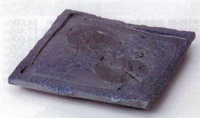
×176-11 黒窯変ポタモチ正角皿 22×22×2.8cm 4,500円