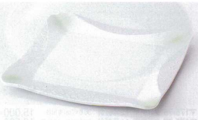
ミ176-16 ラスターヒワ正角大皿 25×25×2cm 4,000円