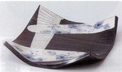
ミ176-14 手造り黒土小花正角盛皿 22.5×22.5×3.7cm 4,200円