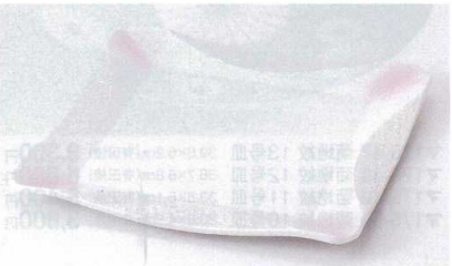
ミ176-15 ラスターピンク正角大皿 25×25×2cm 4,000円